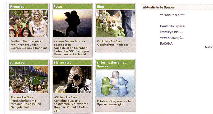
Interaktivität im Internet: Der User lässt (z.T. in der Realität noch nie angetroffene) Freunde an seinen Gedanken und Bildern teilhaben.

Durch die oben genannten Programmierschnittstellen und Neuerungen beim Programmieren von browsergestützten Applikationen ist es dem allgemeinen Internetnutzer, der nicht über ausgeprägte oder aber gar