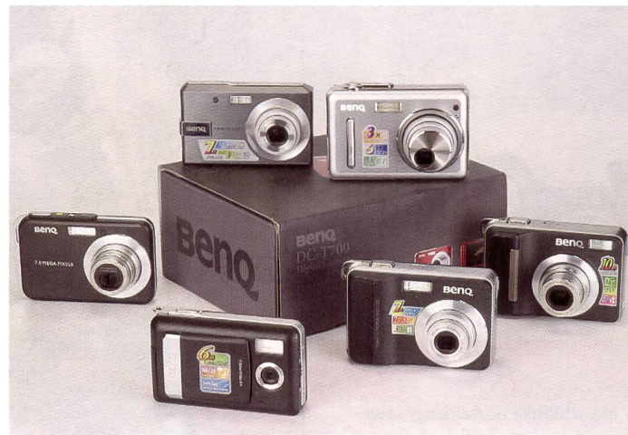
Die noch junge Marke will sich mit einem einheitlichen Design und einem guten Preis-/Leistungs-Verhältnis ihren Platz im Markt sichern. Neben dem Absatz über Fachmärkte und Grossverteiler sucht die junge Marke nun zusammen mit Wahl Trading AG ihren Platz im Fachhandel.

BenQ bietet ein immer runderes Sortiment an Digitalkameras an, die seit der Professional Imaging von der Wahl Trading AG auch dem Fotofachhandel angeboten werden. Welches sind die aktuellsten Modelle? Wir haben einige Highlights herausgepickt und besprechen sie in diesem Artikel.