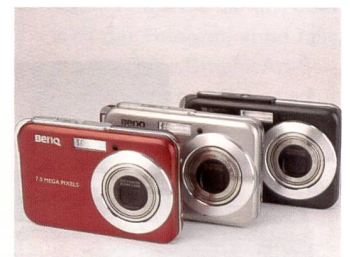
X - oder eben extraschlank. So kommt die gleichnamige Serie von BenQ daher. Lifestyle pur.

len Betriebsarten und bietet dafür eine Fülle an Motivprogrammen, die in der Regel absolut selbsterklärend sind (Gebäude, Kinder, Lebensmittel, Feuerwerk, Sonnenuntergang ...). Schlank sind die Modelle E600/E605 nicht zuletzt dank ihrer rotierenden Objektive. Beim Aus- und Einfahren der Objektive rotieren diese um die eigene