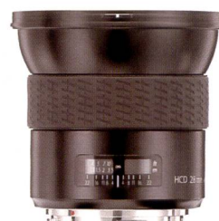
Das neue 28mm Weitwinkelobjektiv wurde speziell für die H3D-Kamera von Hasselblad gerechnet.

Vor einigen Jahren hat sich Hasselblad überraschend vom quadratischen Format verabschiedet