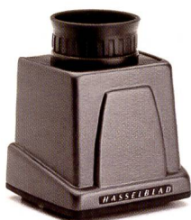
Der neue HVM Lichtschachtsucher für die H-Systemkameras lässt das Hasselblad-Feeling aufkommen.

Die dramatischen Änderungen der Fototechnik haben Fotografen und Hersteller von Kameras und Zubehör gezwungen, umzudenken. Wer im Business erfolgreich sein will, muss sich den veränderten Gegebenheiten anpassen. Im Bereich der Mittelformatkameras ist dies besonders deutlich geworden. Viele Fotografen haben ihre Mittelformat-