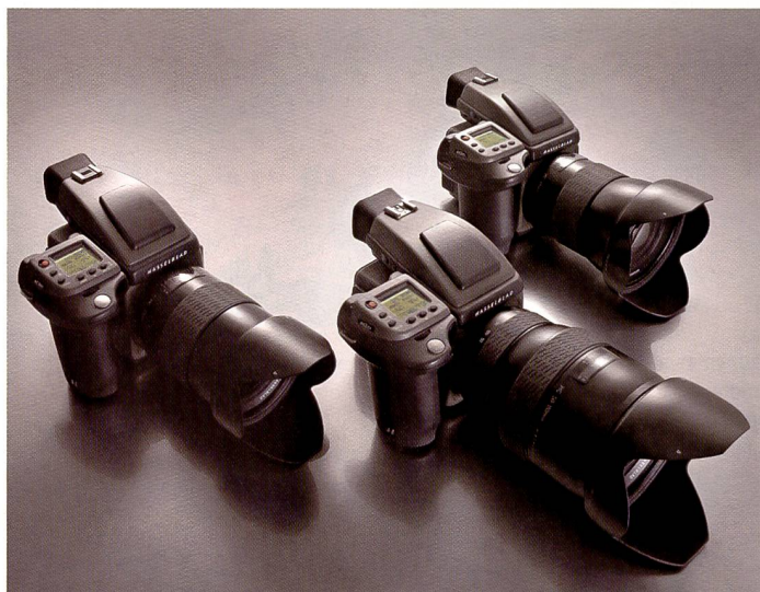
Die Hasselblad H3D ist in drei Versionen erhältlich: Die Kamera mit 22 und 31 Millionen Pixel wird eher in der Porträt- People- und Modofotografie Anwendung finden, während die Architektur-, Stilllife und Landschaftsfotografie vorwiegend die Domäne der 39 Mpixel Version ist.

Gemessen an den Consumer-Kameras sind Neuheiten im Mittelformat selten. Doch die Fortschritte im Bereich der professionellen Kameras sind enorm. Mit der Hasselblad H3D, die als 22-, 31- und 39-MPix Version erhältlich ist, will man abgesprungene Profis wieder ins Boot holen.