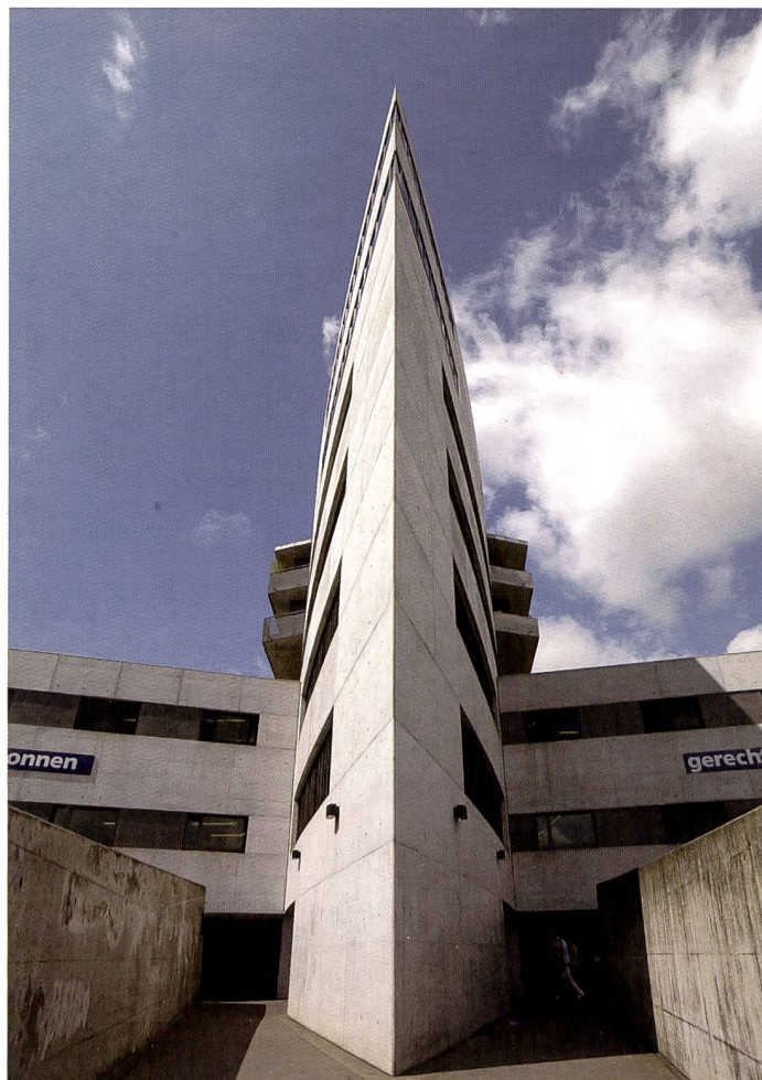
Der Bildwinkel des neuen 28mm Weitwinkelobjektivs verleitet zu Architekturfotos mit spektakulären Perspektiven.

Auch Aufnahmen mit tiefem Kamerastandpunkt sind mit dem bewährten Lichtschacht angenehmer zu bewerkstelligen und die Bildkomposition ist einfacher zu überprüfen (wenn auch mit