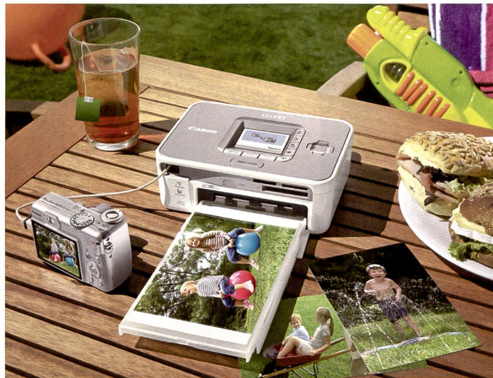
Die neuen Canon Selphy-Printer CP-740 und CP-750 bauen auf der grossen Tradition des japanischen Unternehmens im Imaging-Bereich auf.

Seine Premiere feierte die Ixus-Modellreihe im Jahre 1996; dannzumal als Pocket-APS-Kamera. Die Kameras der Ixus-Reihe sollten sofort durch ein unverwechselbares, eckiges Design erkennbar sein. Seit ihrer Einführung wird im Durchschnitt alle zehn Sekunden eine Ixus-Kamera verkauft. Das markante eckige Design mit der unver-