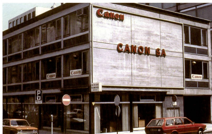
Die erste Canon Filiale in Europa: 1957 in Genf.

Daten, die angesichts der heutigen Zahlen eher müde lächeln lassen. Vergleicht man etwa die Auflösung mit der neuesten Kamera in der Powershot-Reihe, der S5 IS. Die Powershot S5 IS – eben vorgestellt und ab sofort für CHF 818.– im Fachhandel erhältlich – verfügt nämlich über acht Megapixel. Für die Powershot 600 auch noch mehr als undenkbar: Das 12fach optische Zoom, mit einem Brennweitenbereich von 36 – 432 mm (äquivalent zu Kleinbild).