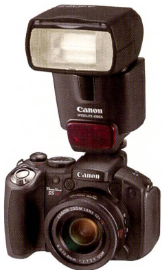
Neues Powershot-Modell mit Blitzschuh für den Anschluss von Speedlite-Blitzen.

ternehmens in mehr als 110 Ländern Europas, dem Nahen Osten und Afrika verkauft. Europa ist heute für Canon verkaufsmässig die wichtigste Region – 2004 wurde Amerika abgelöst. Fast ein Drittel aller Kamera der japanischen Firma werden hier abgesetzt. 11'000 Angestellte zählt die Firma in Europa, aus der «Bieridee» wurde in Europa eine Firma mit einem Umsatz von über zehn Milliarden Franken.