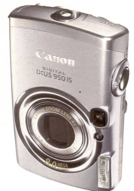
Die Ixus 950 IS: Neuste Modell in einer ganzen Reihe von Stilikonens seit 1996.

Das Europageschäft von Canon bildet heute die Drehscheibe zu einem weit reichenden Markt für die Produkte von Canon. Von hier aus werden die Produkte des Un-