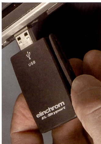
Der USB RX wird am USB-Anschluss des Computers installiert und ermöglicht die Steuerung sämtlicher mit Transceiver RX ausgerüsteten Leuchten durch die Software.

geschlossen und von dort aus auch mit Strom versorgt wird. Wenn die Software installiert ist, können RX-Geräte kontrolliert und eingestellt werden. Die Software kann beispielsweise auslesen, wie oft ein bestimmtes Gerät eingeschaltet wurde oder wie viele Blitze von diesem Gerät ausgelöst wurden. Das Programm erkennt automatisch RX-Geräte, aber auch den Universal Receiver, wodurch diese ebenfalls in die bestehenden Gruppen integriert werden können. Auch Stroboskop Effekte sind möglich.