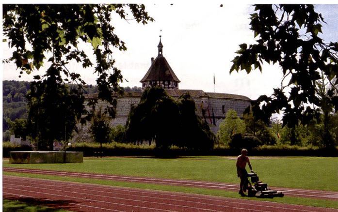
Einsteigern bietet die K100D Super stark automatisierte Aufnahmemodi, die eine Aufnahme praktisch immer gelingen lassen.

erfordert aber öfter auch langes «Scrollen». Häufige Einstellungen (wie ISO-Zahl oder Weissabgleich) können mit der Kombination Funktionstaste plus Wählkreuz schnell angesteuert werden. Die Kamera fühlt sich gut in der Hand an, hat eine angenehme Grösse und die Kunststoffummantelung ist solide.