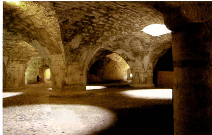
Die K100D Super im «Bauch» des Munots: Neutrale Farben, ein relativ grosser Kontrastumfang und das bei ISO 3'200 und mit AWB.