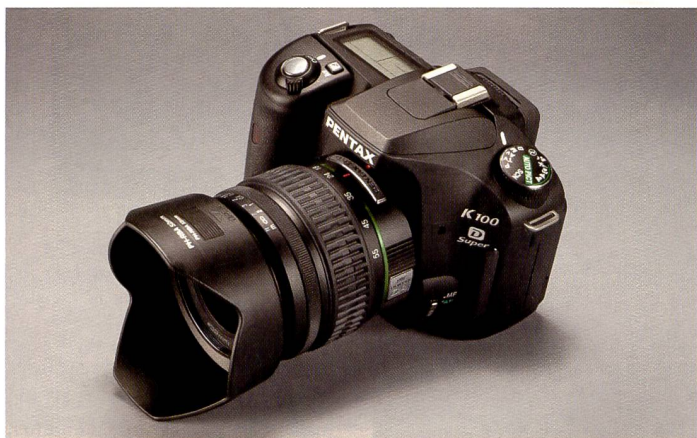
Selten bei einer Kamera in diesem Preissegment ist das zweite Display auf der Oberseite der Spiegelreflexkamera.

Man kann es sich also durchaus einfach machen mit der Kamera und die Pentax als «einfache Knipse» benutzen: Dafür liegen Motivprogramme und zahlreiche automatisierbare Funktionen