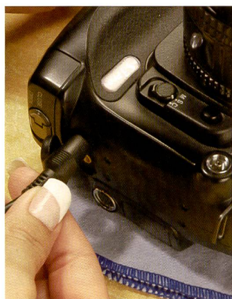
Die Kamera wird am besten mit dem Netzgerät verbunden. Sonst könnte der Verschluss mitten im Service zuschnappen.

Ich erinnere mich immer gern an meine Reisen. Unterwegs im Südwesten der USA habe ich damals tausende von Dias geschossen. Einige davon sind noch in meinem Archiv zu finden. Manche helfen mir einfach, meine Erinnerungen wach zu halten. Kunstwerke sind kaum dabei. Leider sind einige Bilder, die aus heutiger Sicht interessant wären,