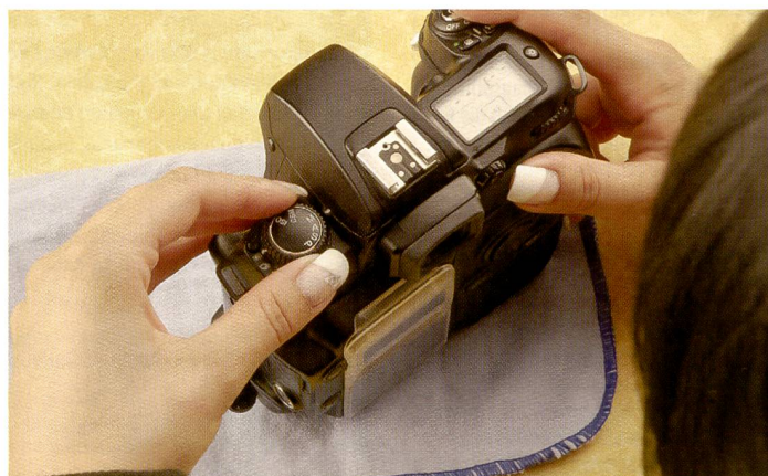
Je nach Kameramodelle wird die Einstellung für die Sensorreinigung im Menü oder an Einstellelementen an der Kamera vorgenommen. Der Spiegel muss ausgelöst, der Verschluss geöffnet werden, ohne dass der Sensor aktiviert wird.

Das lästigste Problem beim Fotografieren mit einer digitalen Spiegelreflexkamera ist der Staub, der bei jedem Objektivwechsel den Weg in die Kamera findet und sich dort irgendwann auf dem Sensor niederlässt. Wie wird man dem Problem Herr? Und: Soll man den Sensor etwa selbst reinigen?