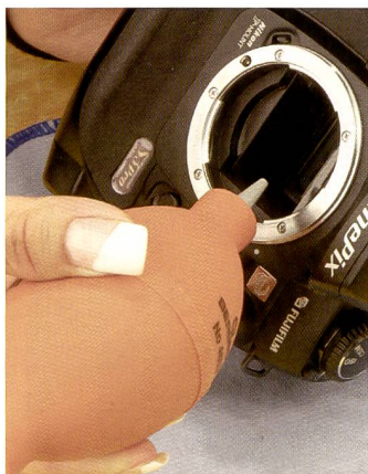
Lose Staubpartikel lassen sich mit einem Blasebalg entfernen. Das geht schnell und einfach und ist erst noch umweltfreundlich.

Eine günstige und umweltfreundliche Methode bietet der Staubbläser («Bergeon No. 4657», oder der «Hurricane Blowers VD 010» von Visible Dust) mit seiner PVC-Spitze. Ein Ansaugventil im Boden des Bläfers verhindert, dass Luft durch die PVC-Spitze angesaugt wird. Höchste Vorsicht ist geboten, um nicht aus Versehen den Spiegel oder den Verschluss zu beschädigen. Ausserdem sollte man auch die Oberfläche des Sensors nicht berühren, sondern aus gebührender Entfernung den Staub wegblasen. Mit dieser Me-