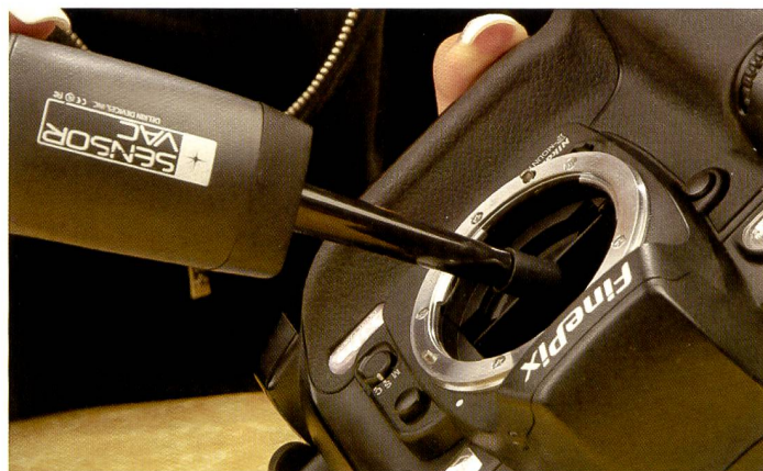
Als Alternative zur Druckluft bietet sich der Staubsauger an. Spezielle Modelle zur Sensorreinigung gibt es von «Visible Dust» und «Delkin». Hartnäckigem Staub kann man auch mit Druckluft aus der Dose zu Leibe rücken. Aber Vorsicht: Neben Druckluft tritt manchmal auch Feuchtigkeit aus.

wart, allzu sorglos mit der Druckluft umzugehen. Der Spiegel der Kamera sollte definitiv nicht damit gereinigt werden! Die Oberfläche des Sensors ist sehr empfindlich und sollte nicht direkt mit dem mitgelieferten Kunststoff-Luftröhrchen in Berührung kommen. Ausserdem müssen Luftspraydosen immer senkrecht gehalten werden, weil sonst flüssiges Gas austreten könnte, was wiederum den Sensor verschmutzen würde (Sprühdosen sind oft mit verflüssigtem Butan- oder Propangas – oder ähnlichem – gefüllt).