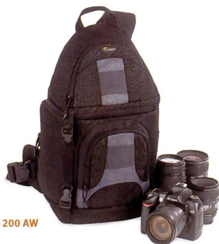
SlingShot 200 AW

Im Handumdrehen vom Tragekomfort eines Rucksackes zum Schnellzugriff einer Hüfttasche.