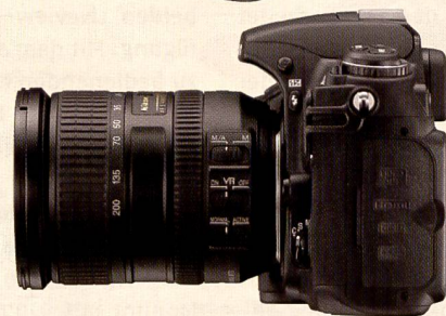
Die neue Nikon D300 löst die D200 ab und bietet modernste Technologie sowie viele Eigenschaften der D3: Liveview, neues Autofokussystem und identische Belichtungsmesseinheit.

Zeit bei der Nachbearbeitung. Die neue Funktion «Aktives D-Lighting» der D3 steigert die Qualität des JPEG-Speicherformats. Vor der Aufnahme eines sehr kontrastreichen Motivs kann der Fotograf eine voreingestellte Kurve anwenden, die die Detailzeichnung in Licht- und Schattenpartien verbessert, ohne dass die Brillanz der Aufnahmen leidet.