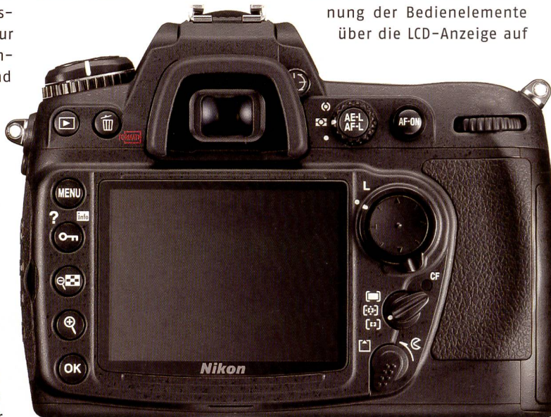
Die Rückenansicht der Nikon D300: Besonders beeindruckend ist das 3 Zoll LCD. Die 920'000 Bildpunkte entsprechen einer Vervierfachung gegenüber dem Vorgängermodell D200.

Ein Zubehörteil, das die Aufnahmebetriebsdauer verlängert, die Ergonomie bei Aufnahmen im Hochformat verbessert und die Bildfolge auf bis zu acht Bilder pro Sekunde (bei Verwendung der EN-EL4a Stromquellen) erhöht, ist der Multifunktionshandgriff MB-D10. Der kompakte MB-D10 wird einfach an der Kameraunterseite befestigt und belegt nicht das Akkufach der Kamera, sodass ein Akku vom Typ EN-EL3e in der Kamera verbleiben kann. Der MB-D10 kann wahlweise mit einem zusätzlichen EN-EL3e oder mit dem leistungsstärkeren Akku EN-EL4a bestückt werden. Auch der Betrieb mit acht Mignon-Akkus bzw. -Batterien (Grösse AA) ist möglich. Der neue Wireless-LAN-Sender WT4 kann wie an der D3 auch an der D300 zur Datenübertragung und Fernsteuerung eingesetzt werden. Die beiden neuen Nikon Gehäuse kosten CHF 7798.- (D3), bzw. CHF 2998.- (D300) und sind in der Schweiz voraussichtlich ab November erhältlich.