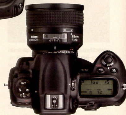
Mit der neuen Nikon D3 steigt Nikon ins Vollformat ein und bietet vor allem den Sportfotografen eine superschnelle Kamera, die bis zu elf Bilder pro Sekunde leistet.

nahmen mit bis zu neun Bildern pro Sekunde im Vollformat und elf Bildern pro Sekunde im DX-Format, ein Empfindlichkeitsbereich von ISO 200 bis 6'400 mit zusätzlichen Optionen für die Erweiterung (HI/LO) von ISO 25'600 bis auf ISO 100, ein völlig neues Autofokussystem mit 51 Messfeldern, ein 3-Zoll-LCD-Monitor mit Live View sowie ein hochmodernes Bildverarbeitungssystem.