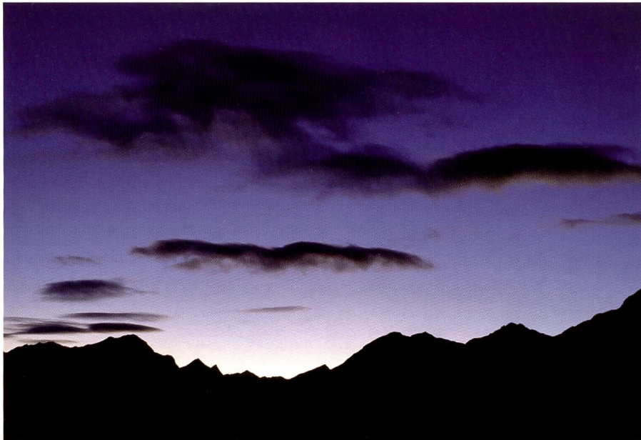
Föhnstimmung in den Schweizer Alpen. ISO 100, 35 mm, Blende 5.6, Belichtungszeit 1 s.