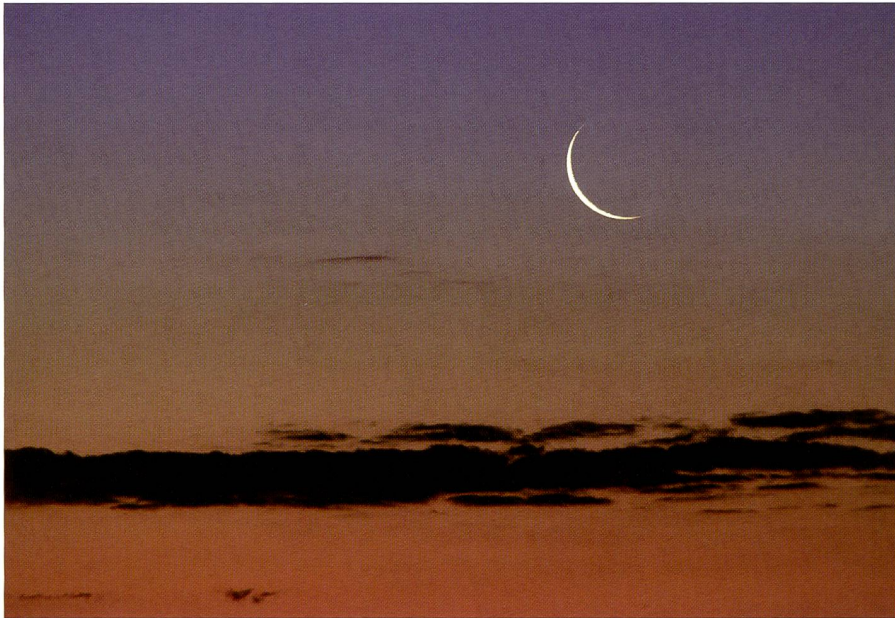
Die Mondsichel verstärkt den farbigen Eindruck des blauen Abendhimmels noch. ISO 100, 420 mm (300 mm mit 1.4x Telekonverter), Blende 8, Belichtungszeit 1 s.

sondern erst auf den Computer übertragen und dort Korrekturen anbringen. Markus A. Bissig speichert die Bilder grundsätzlich im RAW-Format und