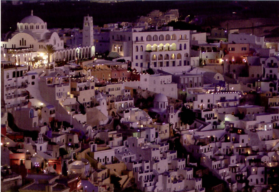
Hier, auf der Insel Santorini, betrug das Zeitfenster lediglich 10 Minuten, um die Lichtsituation so einzufangen, dass die Kunstlichtquellen noch nicht überstrahlen und trotzdem genügend Licht für die Durchzeichnung der Partien im Vordergrund vorhanden war. ISO 400, 100 mm, Blende 2,8, Belichtungszeit 1/8 s.

ganzen Blende Über- und Unterbelichtung sicher nicht falsch, vor allem bei Einsatz von Digitalkameras, da die unpassenden sofort wieder gelöscht werden können.