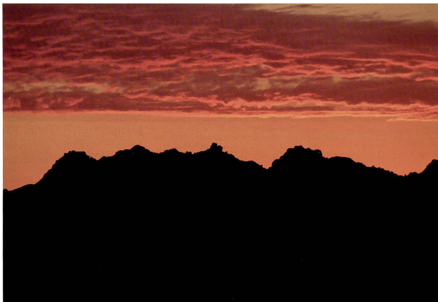
Das Gegenteil der klassischen Blauen Stunde: Gegen den Sonnenuntergang fotografiert, wird alles in ein goldenes Licht getaucht.

ger zufällige Auslösen in einem bestimmten Moment.