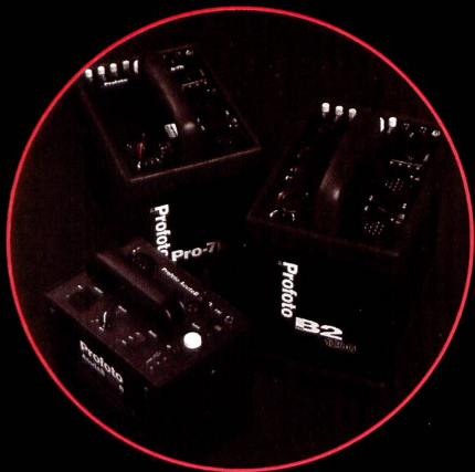
Aktuelle Blitztechnologie von Profoto