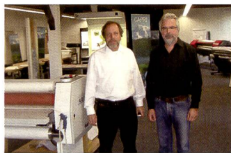
Appel+Siegenthaler ist auch auf Laminierung spezialisiert.

Wenn man den Showroom von Appel+Siegenthaler in Huttwil betritt, so lassen die grossformatigen Ausdrücke und Displays