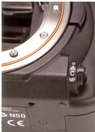
Das Kamerabajonett der Sony \alpha 700 besteht komplett aus rostfreiem Stahl. Bei den Materialien wurde auf Gewichtsreduktion gesetzt.

Dafür ist der Bildschirm ein einziger Genuss. Die über 900'000 Pixel auf dem drei Zoll Monitor