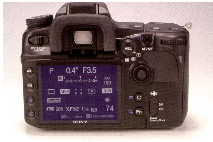
Das helle und detailreiche LC-Display der \alpha 700 mit 921'600 Bildpunkten ist ein Hochgenuss. Nie war die Bildkontrolle einfacher. Mit der Funktionstaste und dem Joystick können sämtliche Einstellungen angewählt und direkt verändert werden.

Bleiben wir noch beim Bildschirm, dieser zeigt weiterhin eine Eigenheit, die bereits in der Konica Minolta Dynax 7D vorkam: Das Display schaltet ab, wenn man mit dem Gesicht dem Sucher nahe kommt. Praktisch, denn wenn man durch den Sucher schaut braucht man das Display definitiv nicht mehr und