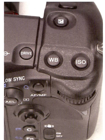
Die Platzierung der Knöpfe und Räder wurde mit Bedacht gewählt, Anpassungen sind so schnell und intuitiv gemacht.

Bei der Bildstabilisierung setzt Sony auf das von Konica Minolta bekannte System. Durch die Integration des Stabilisierungssystems im Kameragehäuse, kann diese Funktion bei allen Objektiven eingesetzt werden. Für die verwacklungsfreien Bilder messen Gyrosensoren die Bewegungen der Kamera und gleichen diese durch eine Gegenbewegung des Bildsensors