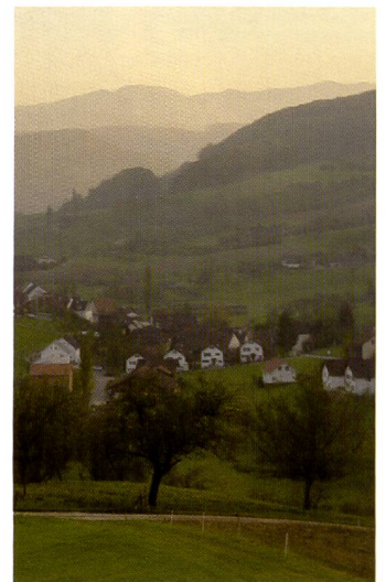
Abendstimmung mit der Sony \alpha 700: Der CMOS-Sensor bewältigt den grossen Kontrastumfang mit einer hohen Farbsättigung.