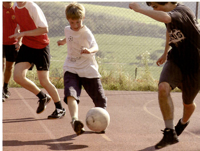
Die Sony \alpha 700 ermöglicht bis zu fünf Bildern pro Sekunde. Im JPEG-Modus kann dann theoretisch geknippt werden bis der Speicher voll ist. Ein Vorteil bei solchen Aufnahmen ist der sehr schnelle Autofokus, der sehr scharf stellen kann, bevor der Auslöser berührt wird.