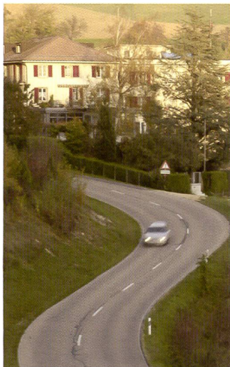
Dank Bildstabilisation keine Verwacklungsunschärfe: Aufnahme bei 75 mm Brennweite und relativ langer Verschlusszeit von 1/8 s.

Überhaupt die Motivprogramme: Für eine semiprofessionelle Kamera wurden davon einige integriert. Im Porträt-Modus etwa wird die Kamera auf warme, weiche Hauttöne und einen verschwommenen Hintergrund optimiert. Ausserdem wurde je ein Landschafts-, Sport-, Sonnenuntergang-, Nachtporträt- und ein Makromodus integriert. Diese sind direkt über das Einstellungsrad (nebst den bekannten PASM, Auto und einer selbstdefinierbaren Einstellung) wählbar.