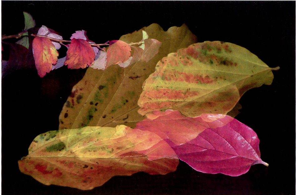
Aufnahme in der Belichtungsart Mehrfachbelichtung mit der Pentax K10D.

Die Mehrfachbelichtung ist eine interessante Funktion welche aus der analogen Fotografie bekannt ist. Mit der Pentax K10D können wahlweise zwischen 2 – 9 Bilder auf einem Foto festgehalten werden. Die automatische Anpassung der Belichtung der einzelnen Aufnahmen vereinfacht die Nachbearbeitung deutlich. Dieses Beispiel ist mit sechs verschiedenen Belichtungen auf einem Bild entstanden. Die Bilder wurden mit dem Pentax smc DA* 50-135 mm und dem eingebauten Blitzgerät aufgenommen. So werden die Farben noch brillanter und der Kontrast wird besser dargestellt. Eine Einstellung welche dem kreativen Benutzer keine Grenzen setzt! Viel Spass beim Testen! Seraina Kurt