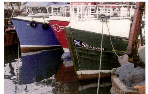
Der Picturemate ist vor allem in dunklen Partien sehr stark, die Schattenzeichnung wird von keinem anderen Drucker im Test übertroffen.

Panasonic-Printer funktionieren nach dem selben Prinzip. Die Kartusche zickt einzig beim Panasonic PX20 ein wenig, so dass doch die Bildchen im Handbuch konsultiert werden müssen. Ansonsten keine Probleme beim Versuchsaufbau mit den vier