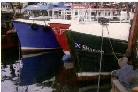
Der Ausdruck ab dem Kodak G610 zeigt sehr gute Farbwerte. Auch der Kontrastumfang wird gut wiedergegeben.