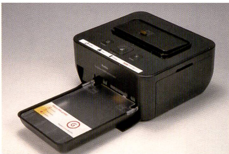
Seine wahre Macht zeigt der preisgünstige Kodak G610 in Kombination mit einer Kodak-Kamera und dem einfachen Datenaustausch.

Die Fotografie, ausgedruckt auf dem Panasonic PX20 scheint bereits einige Jahre auf dem Buckel