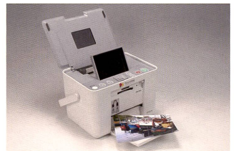
Der Epson Picturemate PM 260 im «Kubus-Design» vertraut auf Tintenstrahltechnologie und setzt damit den Geschwindigkeitsrekord.