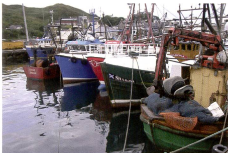
Das Originalbild direkt ab Kamera und ohne Druck- und Scanvorgang als Referenz zur Beurteilung der Bilder.

Am ärgerlichsten bei der Konnektivität ist der Kodak G610: Ein Kartenslot wird vergeblich ge-