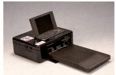
Einfach, schön und schnell: Der Sony-Fotodrucker benötigte für das Beispielfoto nur gerade 45 Sekunden.