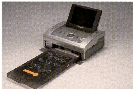
Der Panasonic-Printer PX20 ist der kleinste der Kleinen und verfügt dennoch über ein Display mit einer Diagonale von 9,1 cm.