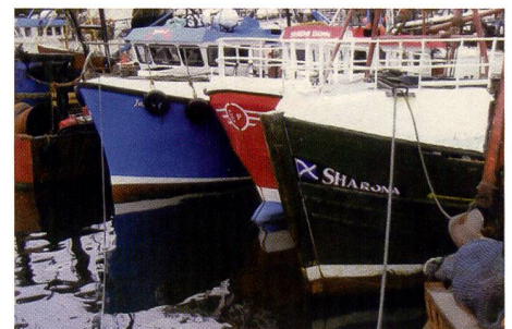
Der Print aus dem Sony-Drucker lässt einige Details in den dunklen Stellen vermissen, sonst aber sehr ordentlich.

auch am meisten Speicherkartentypen. Der Sony-Drucker verschmähst xD-Karten, der Panasonic PX20 zudem auch CF-Karten.