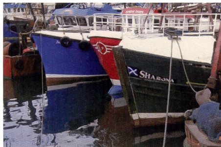
Das eingescannte Bild aus dem Canon-Printer zeigt sehr intensive Farben. Sie sind wärmer als im Originalfoto.