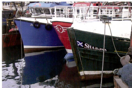
Ein 100%-Ausschnitt aus der Fotografie. Der Ausschnitt wurde so gewählt, dass Farben und Dynamik beurteilt werden können.