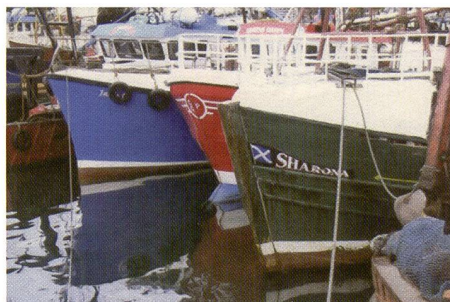
Das Foto aus dem Panasonic-Printer zeigt eher flache Farben, sie tendieren zu einer eher kontrastarmen Wiedergabe.