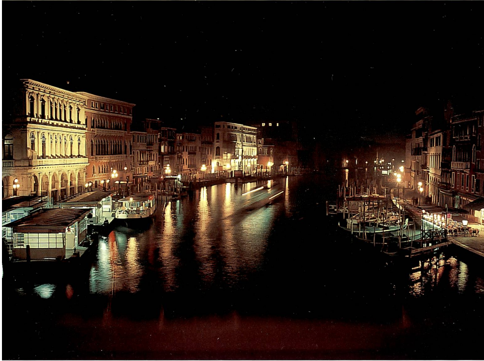
Zweimal Venedig, und doch ganz unterschiedliche Stimmungen. Oben der Canale Grande, bei dem mit Blende 4 und 15 s die Lichter eines Bootes zu Strichen werden. Unten eine einsame kleine Piazza, nur vom Licht der einzigen Strassenlaterne gespenstisch erhellt. Mit 8 s auf Diafilm aufgenommen, zeigen sich deutlich die Farbstiche durch den Schwarzschildeffekt (siehe Text).