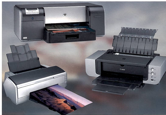
Das Testfeld: Drei aktuelle Drucker für das Format A3+, nämlich der Canon Pixma Pro 9500, Epson Stylus Photo R2400 und der HP Photosmart B9180. Alle drei Drucker überzeugen mit qualitativ hochstehenden Ausdrucken in Farbe und schwarzweiss.

Diese Druckermodelle wurden so konzipiert, dass sie den engagierten Amateurfotografen ansprechen, einfach in der Bedienung sind und sich trotzdem auch in einem professionellen Umfeld bewähren. Sie werden mit eigenen Treibern geliefert oder über Photoshop gesteuert.