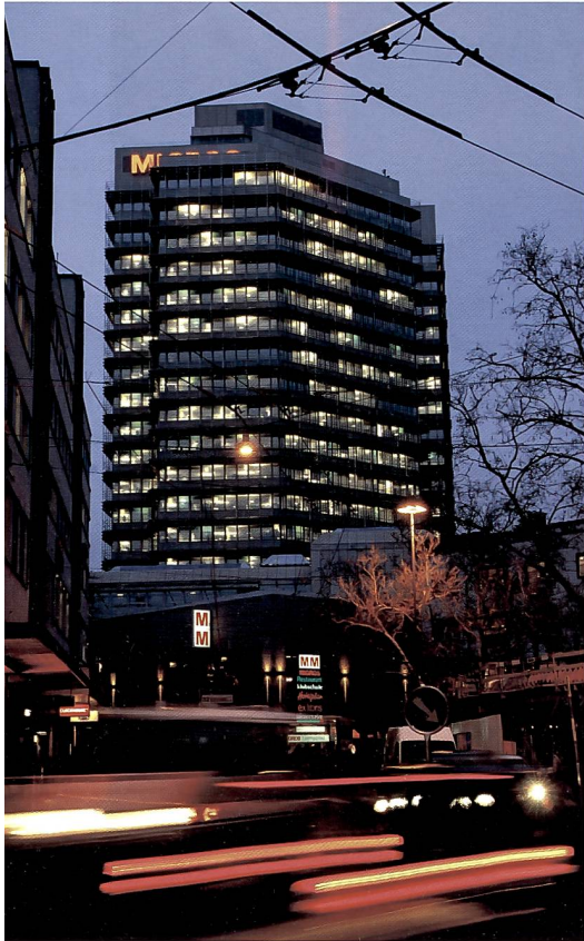
Um eine so lange Belichtungszeit zu erreichen, dass sich die Lichter der Autos zu farbigen Streifen verwischen (8 s) wurde auf Blende 10 abgeblendet.