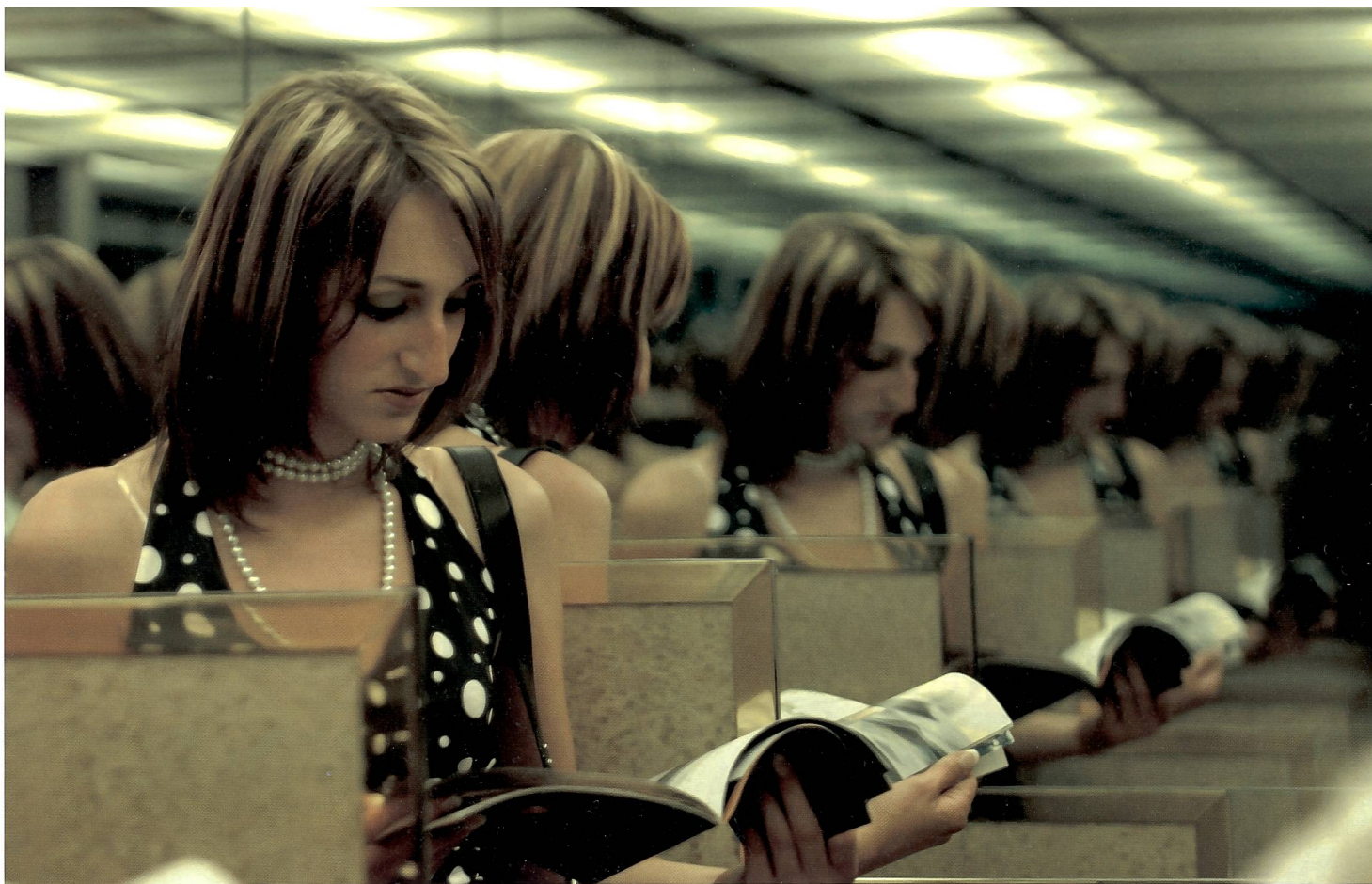
Aufnahme in einem Lift, nur vom vorhandenen Licht beleuchtet und ohne Weissabgleich, damit der Grünstich sichtbar bleibt. Da auf beiden Seiten Spiegel waren, widerspiegelt sich das Modell bis ins Unendliche. Blende 2.8, 1/50 s.

Tabellen der Filmhersteller geben entsprechende Verlängerungsfaktoren an, mit welchen dieser meist unerwünschte Effekt vermindert werden kann. Digitalkameras weisen diesen Effekt zum Glück nicht auf, weil der Bildwandler auch in extremen Belichtungsbereichen linear und damit richtig reagiert. Hingegen wird das Grundrauschen eines Chips immer