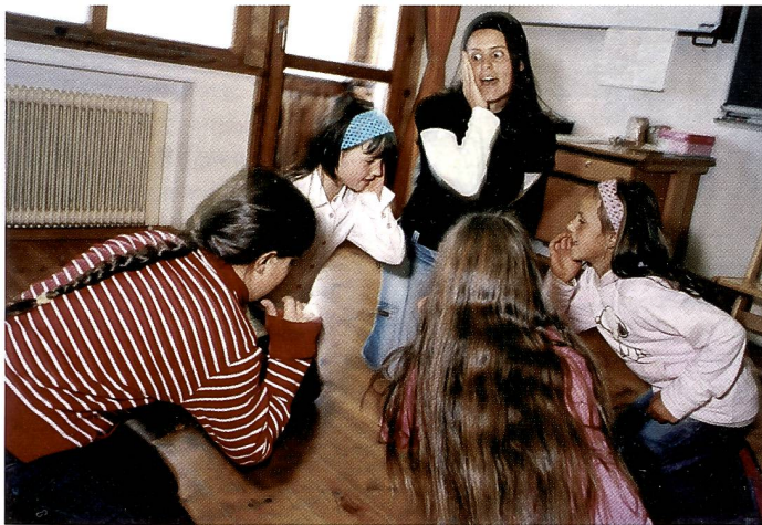
Einzelbild aus der Serie «Bergschule» von Markus Müller-Rasom aus Zürich, eingereicht in der Kategorie redaktionelle Fotografie.

Unter «Fine Arts» klassifizierte Portfolios der konzeptionellen Fotografie machen neugierig und führen zu Entdeckungen. Valentin Jeck ironisiert banale Alltagsgegenstände. Er porträtiert sie nach den Regeln der Schule von Hans Finsler und arbeitet die Prints sorgfältig aus. Es brauchte Mut, diese Bilder zu prämiieren. Sie werden zu Kontroversen führen, denn noch selten hat man einen derart traurigen Staubsauger ge-