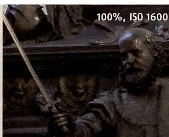
Die Bilder der \alpha 200 oben sind 100% Ausschnitte aus dem Bild unten. Sowohl bei ISO 800 und ISO 1'600 ist deutliches Rauschen zu konstatieren. Daran haben höchstwahrscheinlich auch die 10,2 MPix verteilt auf APS-C-Grösse ihre Schuld.