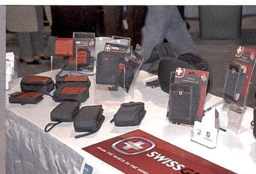
Das Kreuz zieht immer noch an: Die Firma Wenger war mit einer Fototaschen-Kollektion vertreten.

Memory Maker, eine Firma, die in den USA Fotoprodukte wie