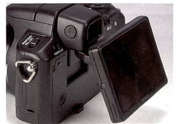
Die Besonderheit der Sony H50: Das aufklappbare Display.

Während etwa bei der Nikon P80 diese Einstellungen bequem und schnell an der Oberseite des