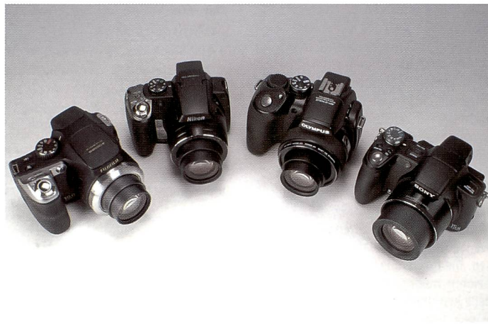
Die vier Kameras mit einem 15-fachen optischen Zoom – oder mehr – im Test. Die Brennweitenumfänge sind beeindruckend, ist es aber auch der Rest der Kamera? Und können die Bildstabis mithalten?

Bei einem schwindelerregenden 20-fachen optischen Zoom, kommt schnell der Gedanke auf: Das kann doch nicht gut gehen! Die Zoom-Monster haben sich dem Test gestellt und dabei durchaus eine gute Figur gemacht. Gibt es sie also, die Kamera, die für jede Situation perfekt ist?