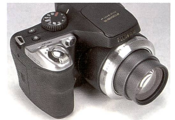
Die Fujifilm S8100fd wird mit AA-Batterien angetrieben.

Die Superzoom-Kamera verfügt über einen 10 Megapixel CCD. Bei reduzierter Auflösung (5 MPix) sind Lichtempfindlichkeiten von bis zu ISO 6'400 möglich. Allerdings ist bereits bei ISO 1'600 deutlich die Rauschunterdrückung sichtbar.