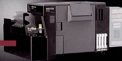
D701 - Neuer Dry Printer mit hoher Leistungsfähigkeit