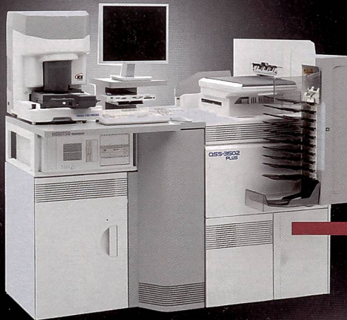
QSS 35 - Series Kompakt- und Bedieneinheit