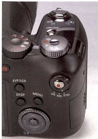
Die Kommandozentrale der schnellen Bridgekamera.

deobearbeitung gibt es den Schneidraum. Ebenfalls sehr einfach aber logisch strukturiert. Speziell mit ihren herausgestellten Features, aber auch mit ihrem Allround-Talent, ist die Casio Ex-F1 eine durchaus überzeugende Superzoom-Kamera, welche einen gelungenen Einstieg in die Welt der Hochgeschwindigkeitsaufnahmen ermöglicht. Nicht nur kreativ Verspielte, sondern auch professionelle Nutzer wie Labore mit begrenztem Budget. Mehr Kreativität im Schulunterricht wäre denkbar, um naturwissenschaftliche Prozesse intensiver visuali-