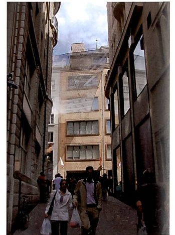
Der Dynamikumfang der Casio Exilim F1 ist zufriedenstellend.

aber machen. Die maximale Auflösung von 512 x 384 Pixel erhält man nur, wenn man die Geschwindigkeit auf 300 Bilder pro Sekunde «reduziert». Will man die vollen 1'200 Bilder pro Sekunde, so muss man sich mit einem überbreiten Cinemascope Bild in den Dimensionen 336 x 96 Bildpunkten begnügen. Die Bildqualität ist bei 300 Bildern pro Sekunde sehr gut, leider sorgten