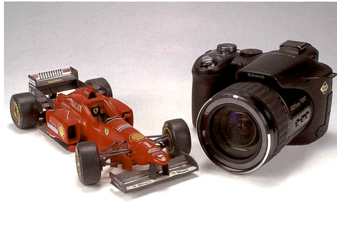
Der Ferrari unter den Kameras: Die Casio Exilim F1 schafft mit stark reduzierter Auflösung bis zu 1'200 Bilder in der Sekunde.

Wer im Juni die Sendung Hitec auf 3Sat sah, konnte einen faszinierenden Einblick in die Welt der Hochgeschwindigkeitsaufnahmen erhalten. Beispielsweise Aufnahmen von Rugby-Spieler bei über 1'000 Bildern pro Sekunde, Explosionen in Extremzeitlupe und viele weitere spektakuläre Filme. Spätestens seit dem Film «Matrix» gehören Hochgeschwindigkeitsaufnahmen beinahe zum guten Ton eines jeden Action-Films. Leider waren diese Kameras bisher nicht nur extrem schnell, sondern auch extrem hochpreisig! Zum Vergleich, die Firma Vision Research bietet mit ihrer Spezialkamera Phantom Miro 3, ebenfalls eine digitale Hochgeschwindigkeitskamera an welche bei ei-