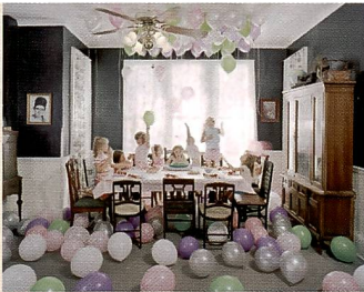
Ohne Titel, 2006, Serie: Left Behind