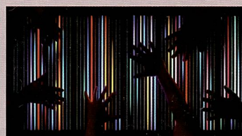
Leuchtstoff-Lichtorgel (Alejandro Sina) im Technorama Winterthur.

Fotografie bedeutet wörtlich «Schreiben mit Licht». Im Technorama Winterthur wird in der neuen Sonderausstellung «ein tiefer Blick in und hinter Licht» geworfen. Die Ausstellung macht das Versprechen wahr und vermittelt Exponate und Experimente, die auch für die Fotografie neue Perspektiven aufzeigen können.