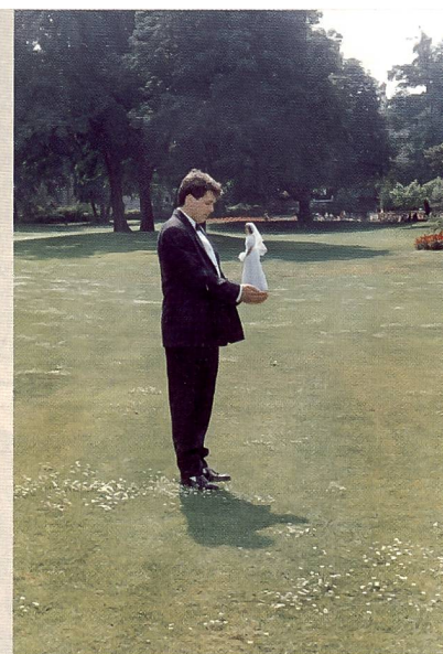
Le plus beau jour # 10, Jean Christian Bourcart

Erfahrungen in der Dunkelkammer aus, wo sich in der Schale langsam das Bild eines Ereignis herausentwickelt, das bereits vorüber ist.