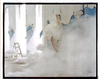
Karen Elson, «Bain de soleil anglais», Vogue Italie 2001