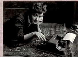
Françoise Sagan.

Ob Françoise Sagan tatsächlich ihre Beiträge zum Feminismus auf einem Orientteppich liegend in die Schreibmaschine tippte, lässt sich nicht mehr rekonstruieren. Das von Sabine Weiss inszenierte Porträt ist jedoch ebenso in die Fotogeschichte eingegangen wie jenes einer mürrischen Clara Haskil oder eines düsteren Eugen Ionesco. Sabine Weiss schloss 1945 ihre Fotografenlehre im Studio Boissonas in Genf ab und ging kurz darauf nach Paris, wo sie als Assistentin von Willy Maywald weitere Erfahrungen sammelte. Bis 1961 war sie für Vogue und danach freiberuflich tätig.