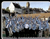
Brassband Imperial Lenzburg