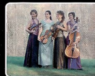
Le Donne Virtuose