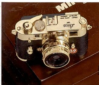
Die kleine Minox M3 als Gold-Edition.

Funktionen nochmals erleichtert wird. Die Anwendungsbereiche des Leica Pradovit D-1200 sind vielseitig: Neben der Projektion digitaler Fotos im grossen Format mit hoher Bildqualität, ist die Wiedergabe von Filmen in Full HD-Qualität, privaten Videoaufzeichnungen sowie Fernsehsendungen ebenso möglich wie die Nutzung von PC Spielen. Er ist ausserdem sehr leise.