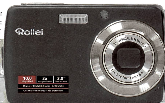
Auch von Rollei gab es eine neue Kamera zu begutachten: Die XS-10 iTouch funktioniert mit Touchscreen.

Mit der Alpha 900 hat Sony eine neue Runde im Pixelrennen eingeleitet. Die DSLR verfügt über einen Sensor mit 24,9 MPix und kostet CHF 4498.- (ausführliche Beschreibung auf den Seiten 14 und 15).