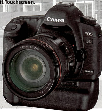
Grosse Neuheiten im Bereich der DSLR-Vollformat-Kameras. Über die neue Canon EOS 5D Mark II und die Sony α900 lesen Sie mehr ab Seite 14.