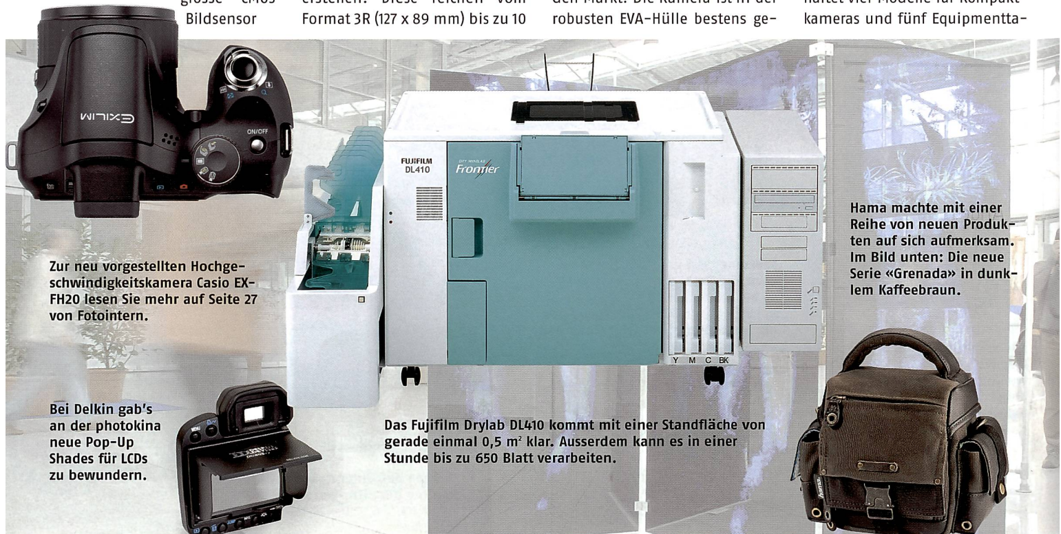
Zur neu vorgestellten Hochgeschwindigkeitskamera Casio EX-FH20 lesen Sie mehr auf Seite 27 von Fotointern.

Die neue Serie «Grenada» beinhaltet vier Modelle für Kompaktkameras und fünf Equipmentta-