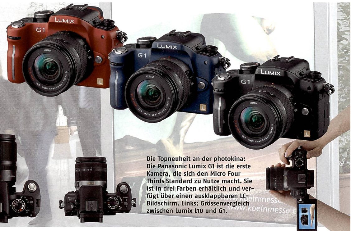
Die Topneuheit an der photokina: Die Panasonic Lumix G1 ist die erste Kamera, die sich den Micro Four Thirds Standard zu Nutze macht. Sie ist in drei Farben erhältlich und verfügt über einen ausklappbaren LC-Bildschirm. Links: Grössenvergleich zwischen Lumix L10 und G1.

lich schnell. Mit einer Geschwindigkeitsrate von 300x – das entspricht einer anhaltenden Mindestschreibgeschwindigkeit von 45 MB pro Sekunde – verringert die neue Lexar Professional UDMA 300x 16GB CF Card die Post-Produktionszeiten. Grund dafür ist eine verbesserte Übertragungsrate zwischen Computer und Karte, wenn diese zusammen mit einem UDMA-fähigen Gerät eingesetzt wird. Zusätzlich ermöglicht es die sehr hohe Kapazität der Karte dem Fotografen, mehr Fotos zu speichern und für eine längere Zeit ohne Unterbrechung zu schiessen.