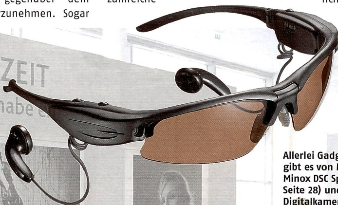
Allerlei Gadgets für Agententräume gibt es von Minox. Dazu gehört die Minox DSC Spionagekamera (von Seite 28) und die Sonnenbrille mit Digitalkamera und MP3-Player. Unten: Die Minox DC 8022 WP ist wasserdicht.