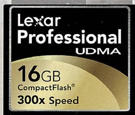
Lexar legt weiter an Geschwindigkeit zu: Die 16 GB CF-Karte gibt's bald mit 300facher Geschwindigkeit.