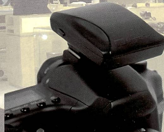
Das «photoGPS» von Jobo (rechts) kann auf den Blitzschuh der Kamera gesteckt werden und reicht dann die Bilder mit Geodaten an.