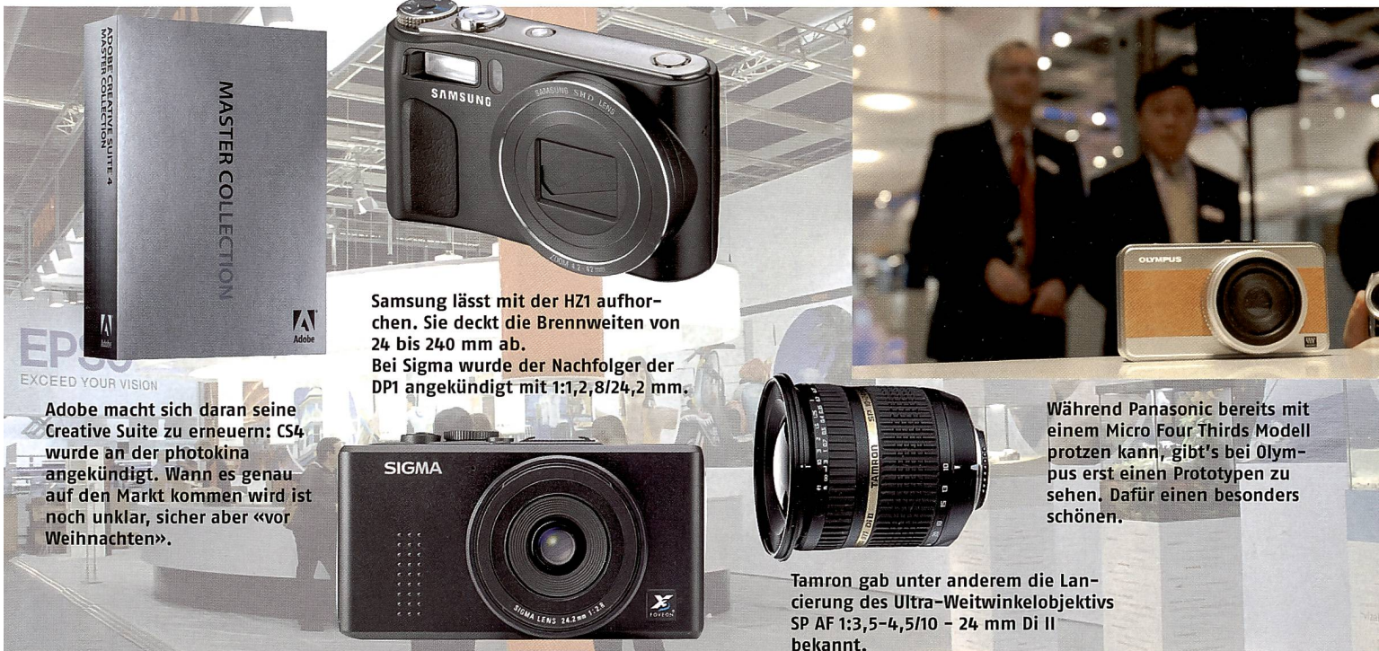
Samsung lässt mit der HZ1 aufhören. Sie deckt die Brennweiten von 24 bis 240 mm ab. Bei Sigma wurde der Nachfolger der DP1 angekündigt mit 1:1,2,8/24,2 mm.

Man hätte eine neue Kamera erwartet, doch Olympus zeigte stattdessen eine Designstudie der neuen Micro Four Thirds Kamera, die nächstes Jahr auf den Markt kommen soll. Die Kamera ist für die neue Micro Four Thirds Objektivlinie konzipiert und soll neue Funktionen im Liveview Modus bieten. E-Objektive können über einen Adapter weiterhin verwendet werden. Die neuen Objektive verfügen über zwei zusätzliche Pins. Das deutet auf interessante Video-Möglichkeiten hin – mit besseren Sound-Features?