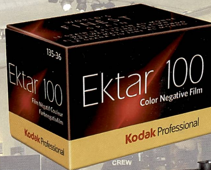
Ein neuer ISO 100 Film von Kodak. Der Ektar 100 soll mit dem «feinsten und gleichmässigsten Korn aller heute verfügbaren Farbnegativfilmen» punkten.