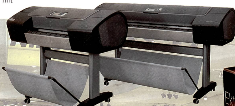
Der HP Designjet Z3100 hat einen Nachfolger; der Z3200 erreicht deutlich bessere Ergebnisse bei der Rotwiedergabe. Grund ist die neue «Chromatic Red»-Tinte.

Das Leaf Afi-II Kamera System ist neu um den Dalsa 56 MP Sensor erweitert worden. Mit einer Breite von 56 mm ist dieser Aufnahmesensor optimal für die weitwinklige Fotografie geeignet. Der 56 MP- und 33 MP-Sensor lassen sich mit einer Fingerbewegung