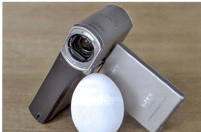
Sony hat mit dem HDR-TG1 einen verblüffenden kleinen Camcorder geschaffen. Bild- und Tonqualität überzeugen.

Der HDR-TG1 (in Deutschland TG3) ist rein äusserlich der Shooting Star des Tests. Das edle Metallgehäuse suggeriert beste Verarbeitung und hohe Qualität.