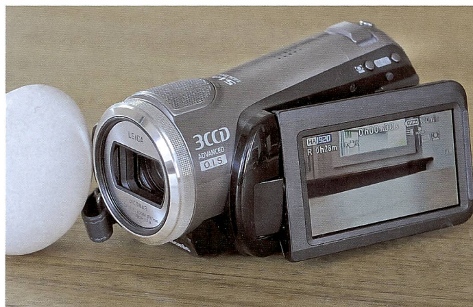
Der Panasonic HDC-SD9 vermittelt dank AC-3 Dolby Digital 5.1 Blockbuster-Gefühle in die heimische Wohnstube.