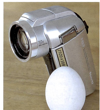
Schicker Revolvergriff beim Sanyo Xacti HD1000.

freie Wiedergabe auf einem HD-fähigen TV-Gerät. Wer die volle Qualität seiner AVCHD-Aufnahmen überspielen möchte, kann das – vorausgesetzt er ist stolzer Besitzer eines Blu-ray-Recorders. Denn nur ein High-Definition-fähiger Recorder ermöglicht letzten Endes die Wiedergabe eines bearbeiteten AVCHD-Signals in voller Qualität. Dazu muss auch das verwendete Editierprogramm nebst AVCHD-Akzeptanz eine AVCHD-Wiedergabe bieten.