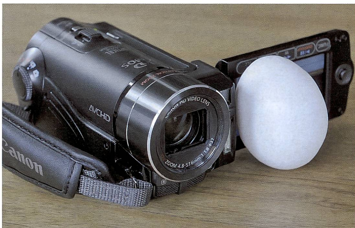
Die Canon HF10 ist die Grösste und Schwerste unter den Winzlingen und eignet sich auch hervorragend für Aufnahmen ohne Stativ.

Wo früher ein platzraubender Kassettenschacht und viel aufwändige Lademechanik dem Camcorder eine Modellfigur vermieste, kommen die Camcorder mit einem kleinen Steckplatz für SD-Cards aus. Das rasch gewachsene Speichervermögen der SD-Cards und Memorysticks hat es den Camcorderentwicklern ermöglicht, auf das Medium Magnetband – und in jüngster Zeit auch auf kleine Festplatten zu verzichten. Der Vorteil hat sich nicht nur in der Miniaturisierung bemerkbar gemacht. Filigrane Mechanik und Motorengeräusche, die sich bei leisen Szenen oft störend bemerkbar machen, sind ebenfalls weg vom Tisch bzw. vom Mikrofon. Ebenfalls zum Schnee von gestern gehören die Sucher. Alle Kandidaten verfügen lediglich über ein klappbares – zwangsläufig leider nicht allzu grosszügiges LCD-Display. Bei vollem Sonnenlicht geht das «Framen» nicht wirklich optimal vonstatten. Warum noch kein Hersteller einen tauglichen Lichtschacht für seine Camcorder als (inklusive) Zubehör anbietet, mutet eigentlich sonderbar an. Spezielle Mühe bereiten alle Displays dem brillentragenden Filmer, der im Alltag zusätzlich auf eine Lesebrille angewiesen ist. Bild- und Tonqualität scheinen mit der Gerätegrösse überhaupt nicht mehr in Zusammenhang zu stehen. Bildaufzeichnung in Full HD (1'920 x 1'080) und Tonaufnahmen in 5.1 Dolbysurround beherrschen die Winzlinge so souverän wie die grossen Schulterfoltern im professionellen Ein-