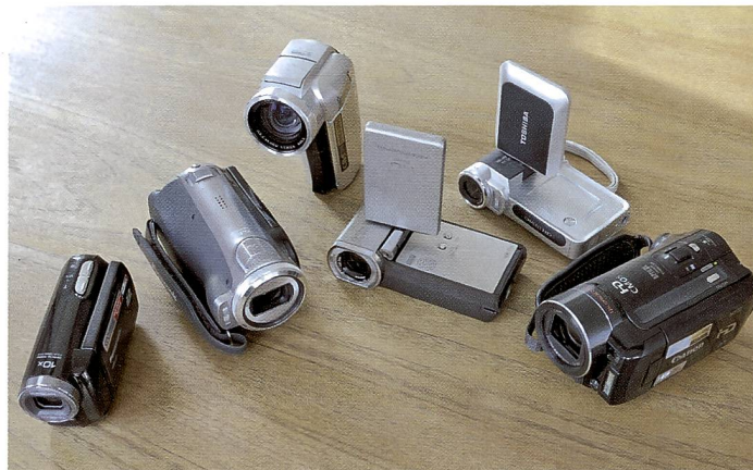
Sechs Camcorder stellen sich dem Test. Eindrücklich ist besonders, was in Sachen Kompaktheit möglich ist.

Heutige Camcorder zeigen eine sehr hohe Qualität in Bild und Ton und Vorteile in Bedienung und Flexibilität. Welches ist die richtige Kamera?