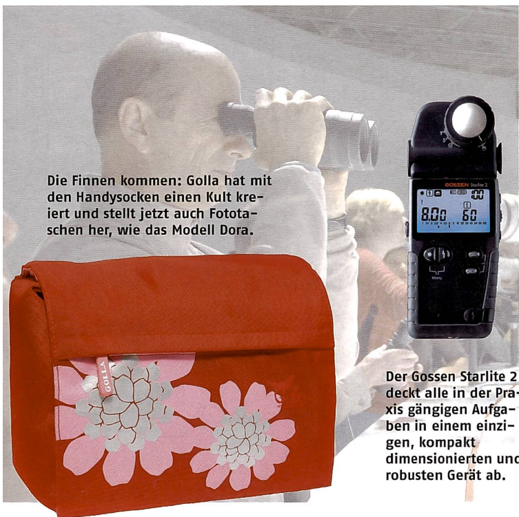
Die Finnen kommen: Golla hat mit den Handysocken einen Kult kreiert und stellt jetzt auch Fototaschen her, wie das Modell Dora.

Im Unterschied zum bekannten Zigview S2, der das Monitorbild vom Kamerasucher «abfilmt», nimmt Zigview S2 live sein Bild aus dem Video-Ausgang der Kamera und ist daher nur an SLRs