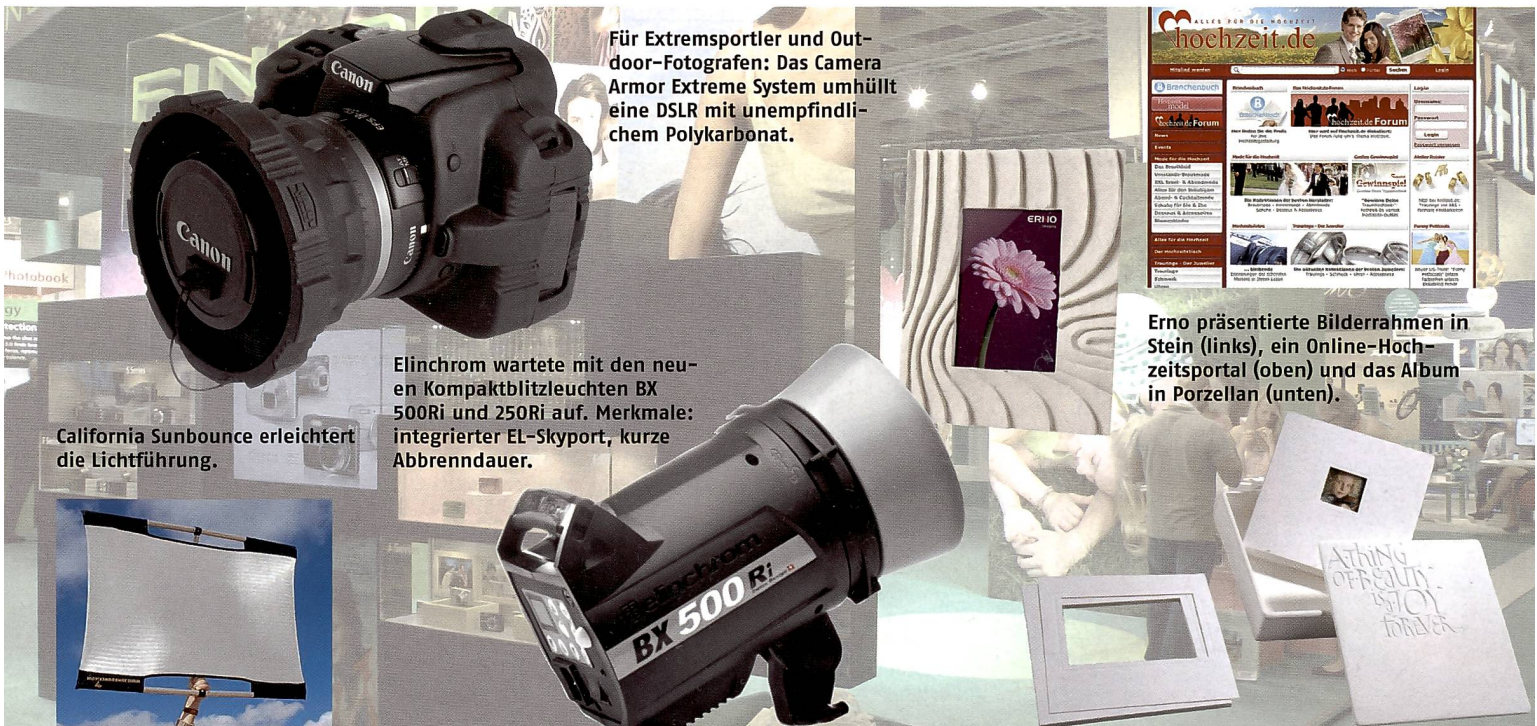
Für Extremsportler und Outdoor-Fotografen: Das Camera Armor Extreme System umhüllt eine DSLR mit unempfindlichem Polykarbonat.

Leistung. Er hat Anschlüsse für zwei Q-Blitzleuchten, die Platz sparend designt, aber mit allen Elinchrom Lichtformern kompatibel sind. Zudem werden die Rotalux Softboxen rundum erneuert mit Streulichtschutz, umsäumten Nähten, neuen Formen und Massen und Wabendiffusor für direktes kontrastreiches Licht. Ausserdem lassen sich die neuen Rotalux Softboxen leichter aufbauen und sie können zusammengefaltet werden, ohne dass sie für den Transport zerlegt werden müssen.