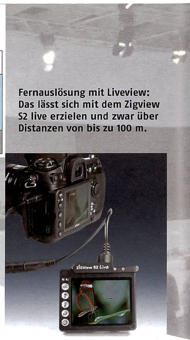
Fernausslösung mit Liveview: Das lässt sich mit dem Zigview S2 live erzielen und zwar über Distanzen von bis zu 100 m.

Allround-Belichtungsmessers. Er deckt alle in der Praxis gängigen Aufgaben in einem einzigen, kompakt dimensionierten und robusten Gerät ab. Der Starlite 2 übernimmt alle Messarten für Dauer- und Blitzlicht bis hin zum Zonensystem mit Direktanzeige der Werte. Die Objektmessung ist mit 1° und 5°- Messwinkel über Sucher möglich. Für die Lichtmessung stehen Diffusoreinstellungen mit sphärischer oder planer Charakteristik zur Verfügung. Als Cine-Meter besitzt der Starlite 2 eine 180°-Umlaufblende. Zusätzliche Sektorengrössen können in 5°-Schritten gewählt werden. Standardisierte und anglo-amerikanische Messeinheiten werden direkt ausgegeben. Für