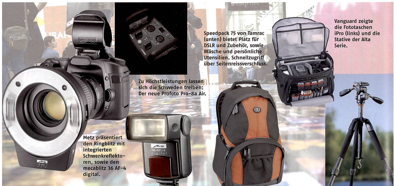
Zu Höchstleistungen lassen sich die Schweden treiben: Der neue Profoto Pro-8a Air.

Mit Alta von Vanguard hat Erno eine neue, preisgünstige Stativserie im Angebot. Die Mittelsäule ist mit einem Antischock-Ring ausgestattet, der ein plötzliches Absinken der Säule abfedert. Am unteren Ende der Säule befindet sich ein Haken, an dem sich u.a. die Kameratasche befestigen lässt. Der Zubehörhaken lässt sich entfernen und durch den Stativteller ersetzen,