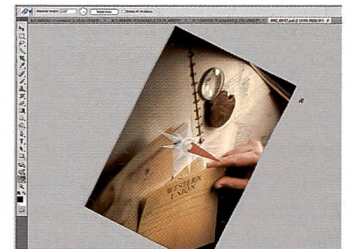
Die Arbeitsfläche lässt sich in Photoshop CS4 frei drehen.

«automatisch Überblenden» dürfte dabei vor allem für Makro-fotografen interessant sein. Bilder des selben Motivs werden automatisch übereinandergelegt (ausrichten) und die jeweils unscharfen Bildteile werden ausgeblendet. Das funktioniert mit Hilfe von Masken, so dass auch noch händisch nachkorrigiert werden kann.