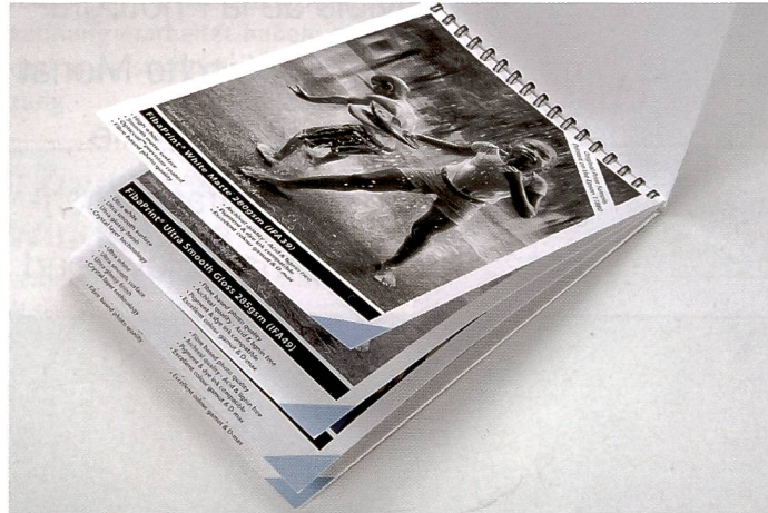
Grosse Sortimentsvielfalt an hochwertigen Papieren in der Königsklasse. Alle Hersteller führen entsprechende Papiermuster.

menarbeit mit Hahnemühle. So lassen sich die verschiedenen Stufen der Fine Art Produktion, angefangen bei der Fotografie mit einer High-End Kamera und den hochwertigen L-Objektiven, bis hin zum Druck mit einem Canon-Drucker auf dem optimalen