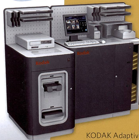
KODAK Adaptive Picture Exchange 74" (Preis auf Anfrage)