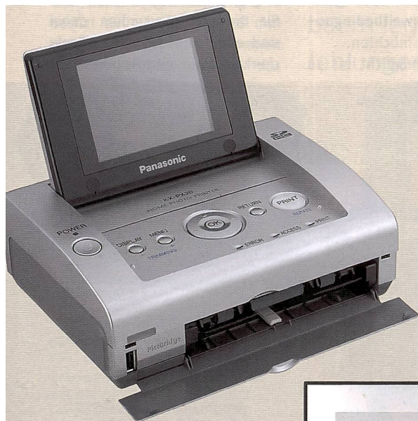
Auf dem PX20 Fotodrucker von Panasonic können Fotos auch im 16:9-Format ausgedruckt werden.

Eine Kamera ist auch Ausdruck des persönlichen Stils. Nach diesem Prinzip wurde die \mu 1040 im schlanken Metallgehäuse ent-