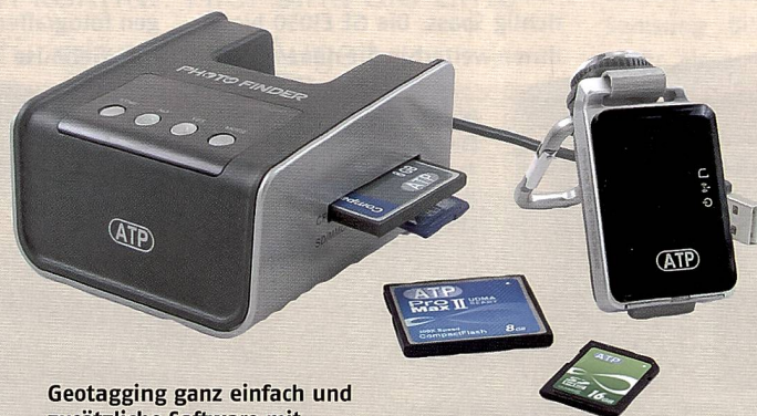
Geotagging ganz einfach und zusätzliche Software mit dem Photo Finder mini.