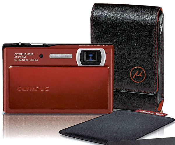
Das attraktive Weihnachtspaket mit Lederetui und LCD-Pad und der Mju 1040 von Olympus.

völlig andere Art der Fotografie, und das gilt ganz besonders für die digitale Spycam. Sie kann jeden Moment aus der Hosentasche gezaubert werden und gänzlich unerwartete, auch unbemerkte, aber jederzeit hochwertige Schnapshotschiessen: Klick und weg. Das kann aus einem Spycam-Fotografen unvermittelt so etwas wie einen «Agent M» mit seiner ganz persönlichen «License to Shoot» machen. Preis: CHF 398.-