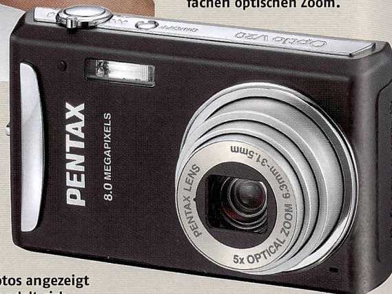
Die Pentax Optio V20 verfügt über einen fünffachen optischen Zoom.