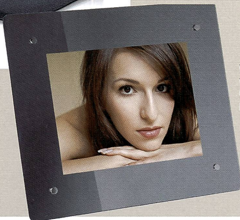
Wenn keine Fotos angezeigt werden, verwandelt sich das Jobo Mirage M Fotodisplay (links) in einen Spiegel.