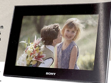
Der digitale Bilderrahmen DPF-V900 zeigt die Fotos auf einem 23 cm grossen Screen an.

glasfront in einem! Das Modell Mirage M von Jobo mit einem 21,3 cm (8,4") grossen Display verwandelt sich mit einem Tastendruck in einen multifunktionalen digitalen Bilderrahmen für eine stilvolle Präsentation der schönsten Digitalfotos. Egal ob im Hoch- oder im Querformat aufgestellt. Auch ein Kalender oder eine Uhr lassen sich anzeigen. Der interne Speicher lässt sich dank Karteinschub beliebig erweitern. Dank des Spiegeleffektes sind die Rahmen auch ausgeschaltet attraktive und Design-schöne Accessoires zuhause oder im Büro. Die Bilderrahmen wer-