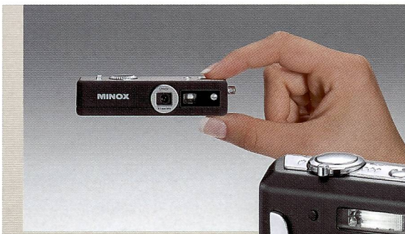
James Bond spielen: Mit der Minox Digital SpyCam.