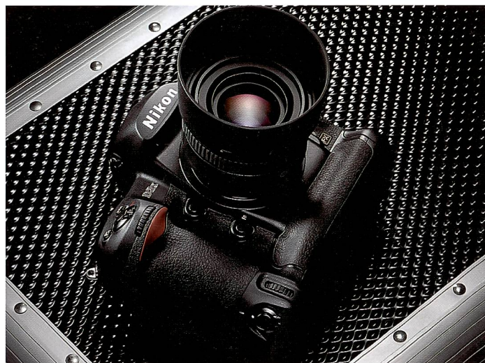
Spekulationen gab es viele, am ersten Dezember wurde das Geheimnis um die Nikon D3x endlich gelüftet. Das Flaggschiff der Nikon Flotte trumpft auf mit 24,5 MPixel und Bildqualität à la Mittelformat.

Mit Spannung wurde die Nikon D3x erwartet, schon Wochen vor der offiziellen Vorstellung der neuen Kamera brodelte die Gerüchteküche. Am ersten Dezember hielten wir die Nikon D3x erstmals in unseren Händen. Ihre Eckdaten: Vollformat, 24,5 MPix, Expeed Prozessor.