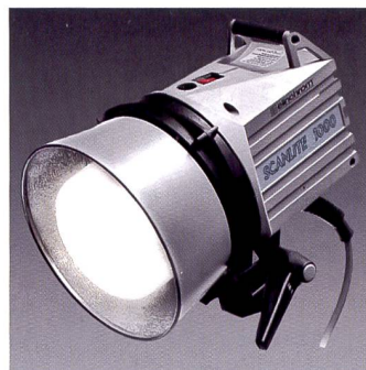
Les lampes halogènes (Elinchrom) possèdent souvent la même baïonnette que les flashes.

Dans les deux cas, il restera que l'une des lumières – en l'occurrence celle différant de la valeur réglée – produira une dominante colorée. Au final, on jugera le résultat acceptable, voire on l'utili-