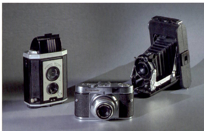
Lumière combinée: ici, des températures de couleur opposées sont en jeu. Boîte à lumière imitant la lumière du jour et lampes halogènes.

Comparé à l'éclair de flashes, l'éclairage continu offre un dosage plus précis de la lumière. Si les photographes de natures mortes l'ont adopté depuis longtemps, celui-ci gagne maintenant de plus en plus d'adeptes parmi les portraitistes et reporters people. Un survol du marché.