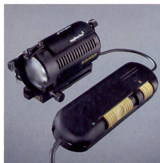
Prisés dans le cinéma, les Dedo-lights (ici avec gradateur simple) ont des adeptes en photographie.