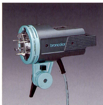
Rendement d'éclairage élevé, mais les lampes HMI (ici Bron) ne sont pas à la portée de tous.

Pourtant déjà connue à la télévision et en production vidéo, cette lumière fut considérée comme une nouveauté par la plupart des studios photo. Comparée à l'éclairage halogène, la lampe