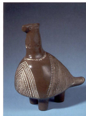
Nature morte photographiée avec un éclairage continu.

pose certaines restrictions. Les lampes halogènes sont souvent appelées Scanlight parce qu'à l'origine, elles étaient conçues pour les dos numériques qui numérisent l'image par plusieurs balayages. Qui achète des lampes tungstène? Le plus souvent des entreprises réalisant elles-mêmes des clichés de leurs produits sans faire appel à un professionnel. Les photographes amateurs constituent un autre segment de clientèle.