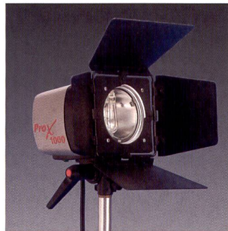
Volets articulés pour un dosage ultra précis de la lumière.

Pour photographier la montre de gousset, nous avons misé sur les qualités qui font la force des Dedolights. L'arrière-plan était éclairé par un adaptateur spot et un gobo, l'éclairage principal était dosé par des volets articulés. Nous n'avons rencontré aucun problème pour combiner le guidage et la mesure de la lumière incidente. Pour se faciliter