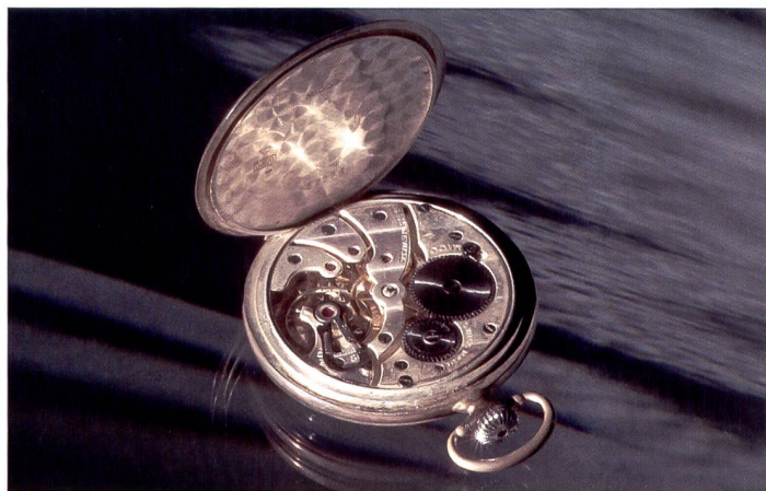
Les petits Dedolights précis font valoir tous leurs atouts dans cette prise de vue. La luminosité pilote aussi les nuances de couleurs.

Fréquemment utilisés au cinéma, les Dedolights constituent un éclairage très intéressant pour les studios photo dans la prise de vue d'objets de (très) petite taille ou pour obtenir des effets de lumières. Ils existent en plusieurs dimensions et puissances.