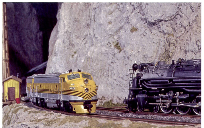
Conditions rêvées pour un éclairage continu: si des halogènes suffisent, on aurait tout aussi bien pu faire appel à des boîtes à lumière à tubes fluo.

Pour photographier le pigeon d'argile, nous avons également utilisé un matériel d'éclairage très rudimentaire: 2 halogènes Elinchrom, équipé chacun d'un réflecteur standard 55°. Les modèles Elinchrom, tout comme ceux de nombreux autres fabricants, possèdent une baïonnette spéciale compatible avec les convertisseurs de lumière de la gamme. Toutefois certains modèles dégagent trop de chaleur comme les spots ou les diffuseurs