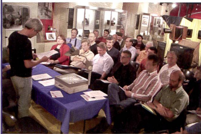
Assemblée des délégués du PpS au Musée Suisse de l'appareil photographique à Vevey

L'association des Photographes professionnels suisses (PpS) a décidé lors de son assemblée des délégués, qui s'est tenue le 4 juin au Musée Suisse de l'appareil photographique de Vevey, de réformer l'actuel apprentissage de photographe. Ce dernier sera remplacé dans les années à venir par un cycle de formation reposant sur une formation préalable aux arts appliqués et sera sanctionné par le brevet professionnel fédéral ou le diplôme fédéral (examen professionnel supérieur).