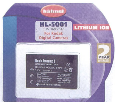
Alternative bon marché de bonne qualité: batteries Hähnel.