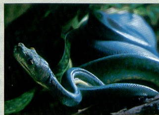
Le Suisse Ivan Baranowski s'est distingué avec cette photo dans la catégorie Wildlife.

Les meilleurs photographes de presse européens ont été récompensés à Bratislava dans le cadre des FUJIFILM Euro Press Professional Awards. Des photographes originaires de plusieurs pays européens ont participé à la sélection finale. Le jury, composé de rédacteurs-illustrateurs et de photographes de renommée internationale, a évalué la force d'expression, la composition et la qualité technique des travaux. En plus de la distinction honorifique, les photographes suivants ont reçu un trophée en jade gravé et un chèque de 10 000 euros: