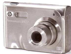
HP PHOTOSMART R 927

LA SEULE CHOSE QUI REND NOS IMPRIMANTES PLUS PERFOR- MANTES: NOS DIGICAMS