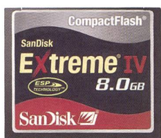
SanDisk Extreme IV CompactFlash®