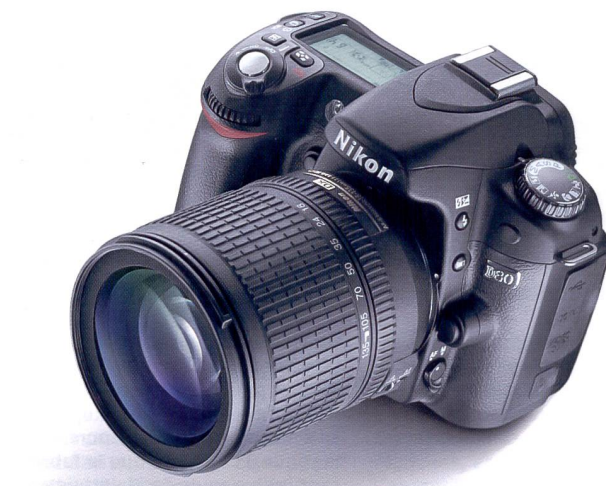
Avec le D80, Nikon entre dans la catégorie des reflex numériques pour amateurs de 10 mégapixels. Sur le plan technique, l'appareil repose sur le D70s.

Pour ceux qui préfèrent contrôler manuellement la balance des blancs et se passer du mode automatique, le D80 offre un choix de six modes d'éclairage spécifiques parfaitement adaptés à la plupart des situations. En plus de ces options, il est possible de mesurer manuellement la température de couleurs en utilisant un objet blanc ou gris comme référence. Le système AF du D80 offre un autofocus sur 11 zones qui assure une mémorisation rapide et précise de la mise au point quelles que soient les conditions de prise de vue. Il est non seulement capable d'utiliser individuellement chacune des 11 zones de mise au