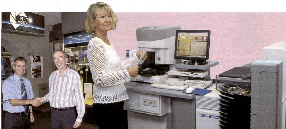
Berne. Le nouveau Minilab NORITSU QSS-3502 installé dans le magasin principal de Photovision SA dans la Marktgasse s'avère être un produit universel rentable pour tous les tirages à partir de données analogiques et numériques.

Cela dépend aussi des réglages de l'appareil, mais nous avons constaté que le NORITSU QSS-3502 restitue les couleurs originales très fidèlement et avec beaucoup de brillance. Les couleurs sont telles que nos clients le souhaitent et non pas