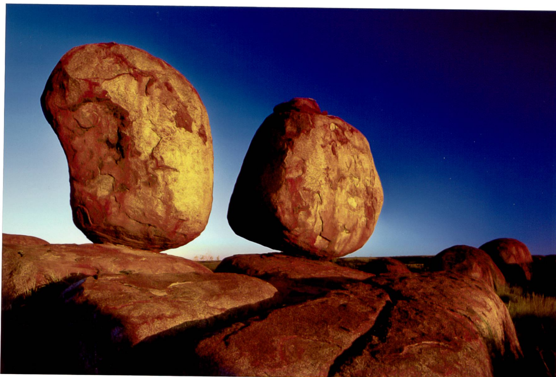
Tirage original ILFORD ILFOCHROME® CLASSIC

fon +41 71 278 15 35 fax +41 71 278 15 37 www.foto-lautenschlager.ch info@foto-lautenschlager.ch