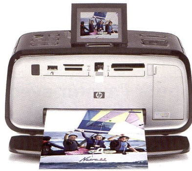
HP PHOTOSMART A717