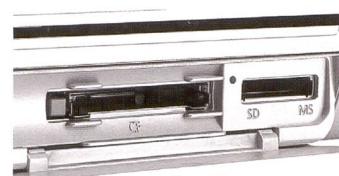
La Selphy ES1 soutient les formats Memory Stick (également pro), Microdrive, MMC, SD Card, CF Card et la nouvelle SDHC Card.

Malheureusement, nous n'avons pu imprimer tous les formats JPEG car le message «format JPEG incompatible» est souvent apparu