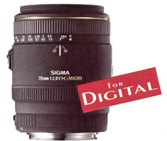
Sigma 70 mm Macro F2,8 EX DG

L'objectif convient aux boîtiers numériques ainsi qu'aux réflex argentiques. Le verre SLD (special low dispersion) utilisé pour les lentilles génère une correction optique efficace des différentes aberrations. Le système de mise au point à éléments flottants assure un excellent piqué du détail depuis l'échelle grandeur nature jusqu'à la prise de vue de sujets lointains. Le traitement multicouche des lentilles élimine les réflexions internes et confère à l'image une brillance exceptionnelle. Un mécanisme de limitation permettant de restreindre la zone de mise au point ainsi qu'une échelle d'agrandissement apportent ensemble une aide bienvenue pour un cadrage précis de l'image.