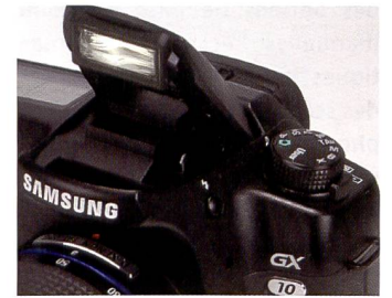
Samsung utilise la baïonnette Pentax si bien que le photographe peut utiliser un grand choix d'objectifs.

accueillir une batterie supplémentaire et doubler ainsi l'autonomie de prise de vue. En personnalisant les réglages, le photographe peut indiquer dans quel ordre les batteries doivent être utilisées. Priorité à la batterie de l'appareil ou à celle de la