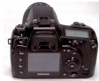
Les images sont retouchées directement dans le GX10, comme p.ex. la correction de la luminosité ou la rotation des prises de vues.

de sélectionner une sensibilité donnée à laquelle l'appareil va automatiquement adapter un couple ouverture de diaphragme/vitesse d'obturation approprié. En mode Tav (priorité couple