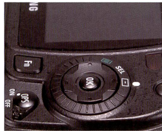
Les principales mises au point du Samsung GX10 sont réalisées grâce à la molette centrale ou au sélecteur à bascule.

Qui s'attend à une prolifération de modes scène va être déçu. Le K10D se concentre exclusivement sur les fonctions d'exposition dédiées aux professionnels avec