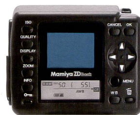
Le dos ZD de Mamiya est un appareil idéal pour les néophytes.

17mm atteindra seulement les performances d'un objectif 25mm, tandis que le grand angle Mamiya combiné au ZD numérique délivre encore l'équivalence d'un objectif 20 mm (petit format). Sans oublier un avantage supplémentaire, qui saute immédiatement aux yeux, du moyen format: l'image lumineuse et panoramique du viseur.