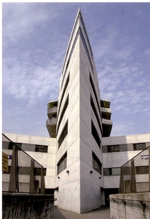
Pour réaliser cette photo, un zoom grand angulaire avec une focale de 18 mm a été utilisé sur un petit format numérique (facteur crop 1,5).

numérique d'architecture ou de studio car il offre 22 mégapixels pour à peine 13 000 francs. D'emblée, il faut toutefois concéder que le dos ZD n'a pas une rapidité idéale pour la photographie en rafale. Son temps de réaction plutôt lent se ressent surtout lorsqu'on veut visualiser des vues ou consulter des informations sur l'image. Les éléments de commande sont disposés rationnellement, la sobriété a présidé au développement. L'écran mériterait d'être un peu plus grand, mais en contrepartie l'acheteur accède à un dos délivrant de très bonnes images à un prix intéressant.