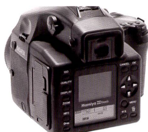
Le dos ZD se monte sans modification aucune sur le Mamiya 645 AFD et AFD II.

fichiers RAW et JPG. Grâce à cette double sauvegarde, le client peut ainsi emporter immédiatement les photos ou bien les obtenir rapidement via e-mail. Ces fichiers JPG ne sont pas a priori de simples thumbnails (vignettes) des vues