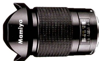
L'objectif grand angle f4,5/28 mm tant attendu de Mamiya.

Il y a un peu plus d'un an, une information a circulé dans la presse annonçant que Mamiya-OP, composé des trois secteurs d'activité Appareils photo, Golf et Appareils électronique, allait transférer son activité photo à une nouvelle société le 1er septembre 2006. Le nouveau propriétaire, Cosmo Digital Imaging, a immédiatement promis de reprendre