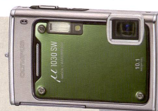
Du plaisir (pas seulement) dans la salle-de-bains avec les modèles «étanches» \mu 1030 SW et \mu 850 SW. Ci-dessous un nouveau record: zoom optique 20x du SP-570 UZ d'Olympus.