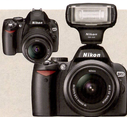
L'an passé le Nikon D40X, cette année le D60 convivial et facile à utiliser.