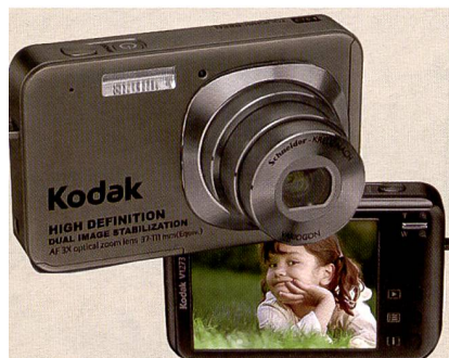
Kodak a présenté l'Easyshare V1273 et les nouveaux modèles Z (pour zoom), ci-dessous: Z8612.

Dans la catégorie des appareils à superzoom également, le cons-