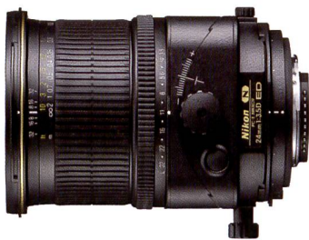
PC-E Nikkor f/3,5/24 mm D ED T&S: vue détaillée.

Le f/2,8-35mm Macro AT-X M35 Pro DX offre à la fois une lumino-