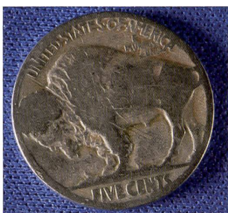
Macrophotographie avec l'AF-S f/2,8/60 mm G ED Micro Nikkor.

L'AF f/2,8/11-16 mm AT-X 116 Pro DX de Tokina est un zoom grand-angulaire idéal pour la photographie sans éclairage d'appoint en raison de sa grande ouverture initiale constante. Grâce au mé-