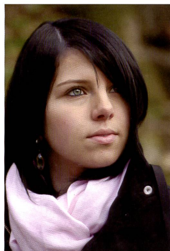
Le Pentax lumineux SMC DA f/2,8/50-135 mm génère aussi des flous esthétiques.

Le «Quick Shift Focus System» permet au photographe de modifier le réglage focal à sa guise, une fois la mise au point réalisée. Il peut également corriger précisément la mise au point momen-