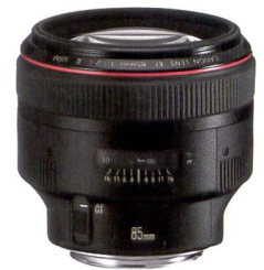
Canon EF f/1,2/85 mm II USM: le spécialiste de la lumière ambiante.

En un mot: les focales fixes sont les spécialistes hors pair de la qualité optique, mais atteignent tout juste la moyenne en termes