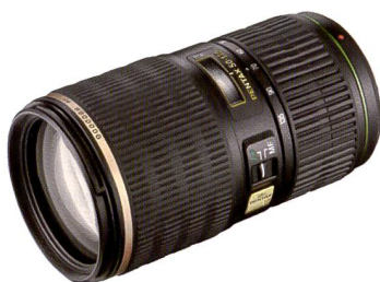
Objectif zoom Pentax SMC DA f/2,8/50-135 mm pour le K20D.

Pentax a lancé fin février deux modèles s'inscrivant comme précurseurs de la nouvelle série star d'objectifs DA. Ils se distinguent par un moteur ultrasonique intégré, spécialement mis au point pour les reflex numériques Pentax.