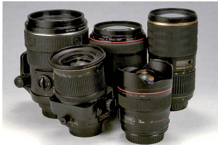
Nous avons, entre autres, testé les objectifs suivants: Canon EF f/1,2/85 mm II USM, PC-E Nikkor f/3,5/24 mm D ED T&S, Olympus Zuiko Digital f/2,0/150 mm, Pentax SMC DA f/2,8/150-135 mm.

Les ventes dérivées sont indispensables pour le commerce de détail. Parallèlement aux cartes mémoire, sacs, trépieds, flashes, etc., les objectifs sont un vecteur clé du chiffre d'affaires mais aussi un facteur de qualité souvent sous-estimé.