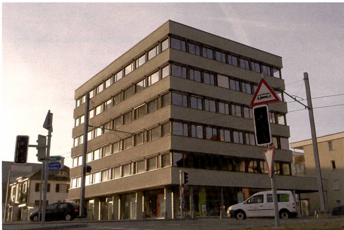
Un phénomène fréquemment de mise dans la prise de vue architecturale: l'appareil est braqué vers le haut ce qui fait converger les lignes; leur fuite vers le haut est marquée, le bâtiment «tombe à la renverse».

La tendance aux objectifs ultra grand angle arrive fort à propos pour Tamron qui lance le SP AF f/3,5-4,5/10-24 mm Di II LD Aspherical (IF). Cet objectif, exclusivement réservé aux reflex numériques à capteurs APS-C, est une version améliorée du célèbre Tamron 11-18mm. Les performances et les spécifications ont bénéficié d'une amélioration. La plage s'étend du grand angle à l'ultra grand angle. La luminosité