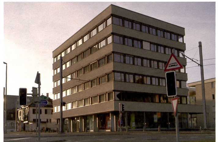
Le mouvement de bascule du PC-E Nikkor f/3,5-24 mm D ED T&S conserve le parallélisme des lignes. Lorsque les bâtiments ont plus de trois étages, mieux vaut ne pas corriger la perspective à 100% car le naturel en pâtit.

stabilisateur d'image lorsque le photographe suit un objet en mouvement dans le sens horizontal ou vertical. La détection du trépied optimise automatiquement le travail du stabilisateur dans la prise de vue sur trépied.