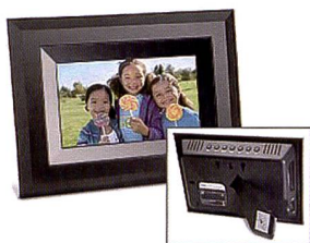
Le cadre Kodak EX 1011 propose des fonctions sans fil.

Commercialisé depuis plus longtemps, le Kodak Easyshare EX 1011 est un cadre photo doté d'un écran TFT 10 pouces au for-