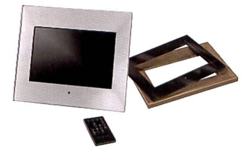
Le modèle 10,22 pouces de Hama existe aussi avec un cadre en bois

USB. Le cadre possède également une mémoire interne (128 Mo). D'une résolution de 800 x