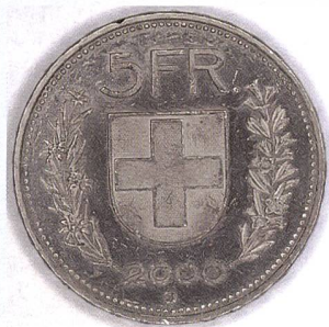
Typique du flash annulaire: lumière uniforme et ombres vers l'extérieur.

Pour finir, nous vous livrons un truc pour la vente: les philatélistes et les botanistes ne sont pas les seuls clients susceptibles de faire des macrophotographies - les dentistes se réjouissent aussi de pouvoir disposer d'un système macro fiable et simple à utiliser. Lors de votre prochain rendez-vous, n'hésitez pas à vous munir d'un tel équipement et à vous laisser photographier par votre dentiste - vous ne sentirez rien, promis juré...!