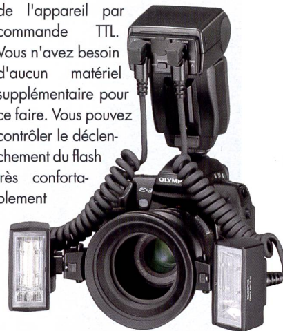
De nombreuses possibilités: Olympus E-3 avec Zuiko Digital 50mm f2.0 macro et le double flash TF-22.

bons résultats. Il suffit de les installer, de définir le groupe de flashes et ensuite de déclencher avec le flash de l'appareil par commande TTL. Vous n'avez besoin d'aucun matériel supplémentaire pour ce faire. Vous pouvez contrôler le déclenchement du flash très confortablement