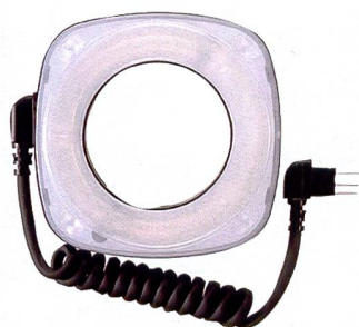
Le flash annulaire RF-11

Ceux qui ne veulent pas de l'éclairage homogène du flash annulaire ou que la réflexion en forme d'an-