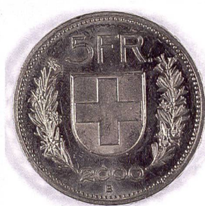
Le double flash (TF-22) souligne l'éclat de la pièce.