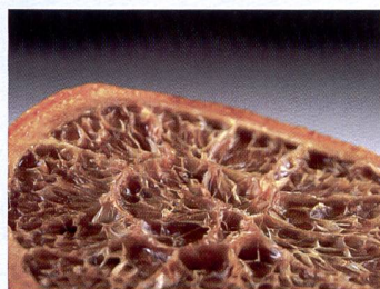
Utilisation simple et luminosité maximale: exemple de flash sans fil avec l'E-3 et deux FL-36R (gauche et droite).

Bien que pour un cadrage identique la profondeur de champ soit légèrement plus grande avec le standard Four Thirds qu'avec le standard argentique classique 24x36 mm, on n'a pas toujours envie de photographier avec une ouverture f2.0. Il faut donc plus de lumière! Le flash intégré ne convient pas pour les prises