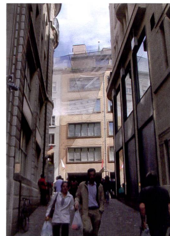
La plage dynamique du Casio Exilim F1 est satisfaisante.

même si certaines parties sont légèrement sujettes au crénelage. A résolution maximale, l'autofocus demande un peu de patience. Quoi qu'il en soit: pour certaines applications, notamment scientifiques, l'appareil devrait pleinement faire jouer ses atouts. La réalisation de 60 vues en une seconde en mode photo devrait également enthousiasmer de nombreux utilisateurs.