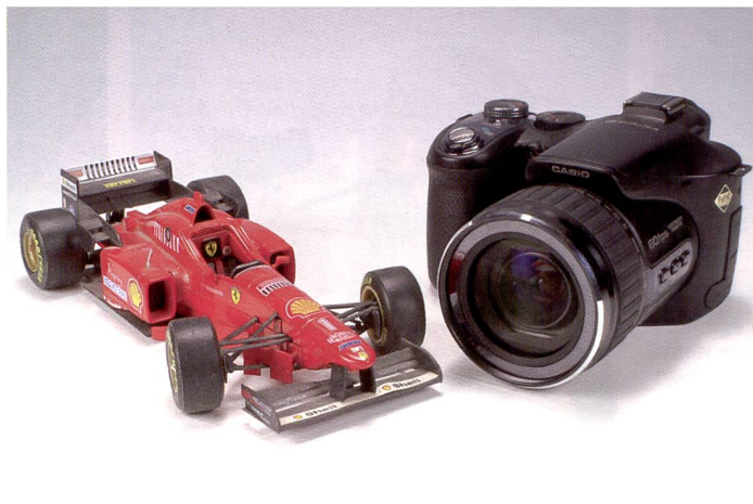
La Ferrari parmi les appareils photo: le Casio Exilim F1 réalise jusqu'à 1200 vps avec une résolution fortement réduite.

La prise de vue à grande vitesse a quelque chose de spectaculaire car elle délivre des ralentis extrêmes, transformant la moindre goutte d'eau du robinet en un véritable événement. En lançant l'Exilim F1, Casio met ce type d'appareil à la portée de «monsieur tout le monde».