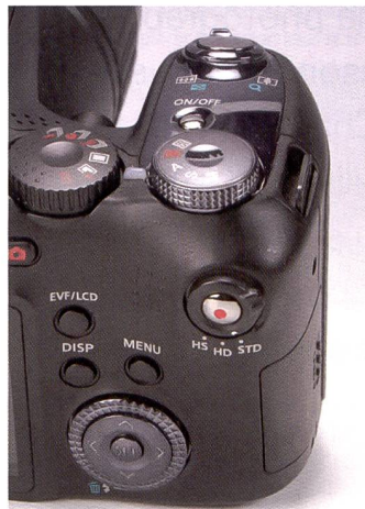
Le centre de commandement du bridge grande vitesse.

HDMI est cependant à déplorer. Parmi les accessoires haut de gamme figurent un pare-soleil et le logiciel dédié «The Casio Digital Camera Software», qui inclut un programme de téléchargement