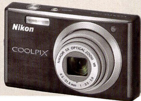
Coolpix S560: le plus petit de sa catégorie, mais avec un zoom 5x remarquable.