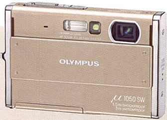
Olympus μ 1050: résistant et étanche.

Modèle d'entrée de gamme chez Pentax, le nouvel Optio E60 bénéficie de plusieurs évolutions pour séduire le marché: résolution élevée de 10 mégapixels, zoom grand angle léger équivalent 32 mm (petit format), sensibilité améliorée jusqu'à 6400 ISO et réduction numérique des vibrations. Pentax continue de miser sur des fonctionnalités pratiques comme une alimentation par deux piles ou accumulateurs de type AA (Mignon) disponibles partout dans le monde - la consomma-