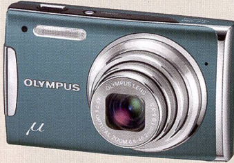
Olympus μ 1060: stabilisateur d'image et touches éclairées.