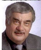
Urs Tillmanns Photographe, journaliste spécialisé et éditeur de Fotointern

L'édition 2008 de la photokina à Cologne a été un réel succès et l'ambiance sur le salon a été extrêmement positive en dépit des nouvelles économiques désastreuses provenant d'outre-Atlantique.