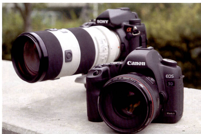
Avec l'arrivée du Sony \alpha 900 dans la catégorie des plus de 20 MPix, la concurrence dans ce segment risque de se durcir. A droite, le tout nouveau Canon EOS 5D Mark II doté de la fonction vidéo.

Avec son \alpha 900, Sony ne réalise pas un exploit technique, mais bat un nouveau record de prix. Jamais 24 mégapixels n'auront été si abordables. Canon, de son côté, repousse les limites de l'innovation en intégrant une fonction vidéo Full HD à son EOS 5D Mark II 21 mégapixels.